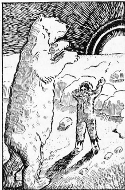
Proti deklici stopa velikanski medved . . .

A otrok je že tekkel, kolikor so ga nesle noge, in se še zmenil ni, kam teče.