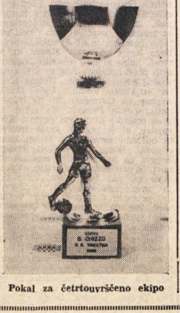
Pokal za četrouvrščeno ekipo

28. in 29. junija bo v Tacnu pri Ljubljani sedemnajsti mednarodni kanu slalom. Letos se je prijaviло kar 10 domačih klubov, od teh štiri iz Slovenije in sicer Ljubljanski brodarstvo društvo Tacna, Hrastnik in Soške elektrarne. Od tujih ekip so doslej prijavili svojo udeležbo Avstrijci, Poljaki, češkoslovaški Avstriji Nemci in Američani. Vseh 5 držav je prijavilo svoje najboljšie kanuiste, saj bo v Tacnu izbirno tekovanje za svetovno prvenstvo. Organizatorji se vedno čakajo na prijavo Italije, Francije in Švice, ki se bodo tekovanja skoraj gotovo udeležile. Vprašanje pa je, če bodo na tekovanje v Tacnu prišli tekmovalci iz Belgije in Zvezne republike Nemčije. Toda že do sedaj prijavljenih 123 tekmovalcev, med katerimi so dvakratni in celo trikratni svetovni prvaki, zagotavlja kvaliteto Tacna 68.