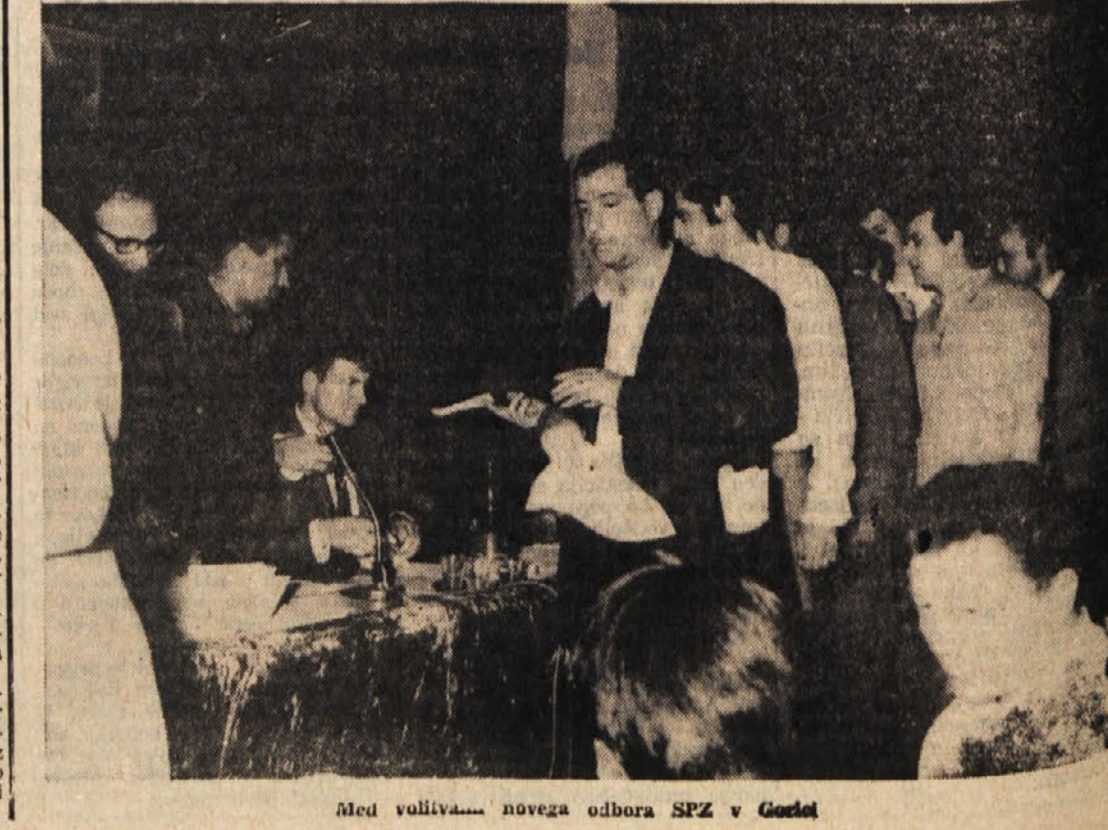
Med volivci... novega odbora SPZ v Gorici

«Mi smo še vedno za celotno združitvi vseh slovenskih prosvet- nih organizacij v zamejstvu. Sed- danji odbor SPZ pa to, kot kaže, odklanja; vsaj kolikor nam je zna- no, ni v tem smislu napravil nobe- nega koraka, da bi prišlo do nekih skupnih stikov. Ni prav, da mi da- nes s tega mesta označimo za nekorišnično morebitno združenje s katoliškimi prosvetnimi organi- zacijami. Danes, ko se vsi borimo za enolični kulturni prostor, danes, ko smo dosežli skupen odbor pri v- pravi našega gledališča, moramo narediti vse, da bo enkrat res pri- šlo do skupne prosvetne organizacije.»