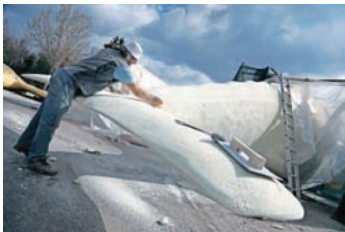
Edo Šćuk pri izdelavi enega od kitov v naravni velikosti

Edo Šćuk je bil doslej kot kipar vajen obdelovati predvsem kamen in druge naravne materiale, zato je bilo pol leta obdelovati predvsem umetne materiale svojevrsten izziv. Pa ne le to