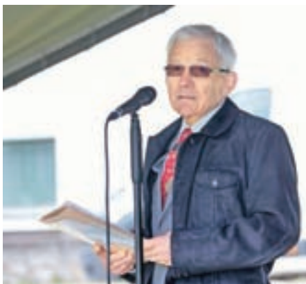
Slavnostni govornik je bil minister za kulturo Anton Peršak.