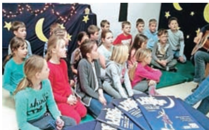
OŠ Pirniče se je drugič priključila projektu Noč knjige.

Noč knjige so obeležili tudi v Knjižnici Medvode, prireditev pa je potekala tudi na Aljaževi domačiji. Pripravila jo je literarna sekcija KUD JaReM. "S svojo prireditvijo smo obiskovalce popeljali v preteklost, ko knjig ni bilo ali pa so bile zelo redke. V čas, ko so bili večeri hladni, noči pa dolge. Takrat so se ljudje v mrzlih zimskih večerih stisnili v toplih "hišah", kakor so imenovali dnevni prostor. Najprej so se pogovarjali o tem, kaj so naredili in kaj bodo naredili jutri. Pritoževali so se nad mrazom, ki je oklepal njihove roke, ko so krmili živino. In potem, ko se je vse zdelo še posebej temno, se je eden izmed prisotnih opogumil in začel pripovedovati, najverjetneje samo kratko novico ali zgodbo, ki mu jo je povedal znanec iz sosednje vasi, ko sta se skupaj grela v gostilni. Med seboj so si pripovedovali tudi dobre nasvete o kmetijstvu, živinoreji, gospodinje pa o kmečkih opravilih in o kuharskih nasvetih. Tak občutek intimnosti smo želeli pričarati v srcu naših obiskovalcev na tokratni Noči knjige. Želeli smo, da čutijo bližino pripovedovalcev in bralcev. In mislim, da nam je to v dobršni meri tudi uspelo. Obiskovalci so se sprostiti, poslušali naše zgodbe, dodali še kakšno svojo in, upamo, odšli domov z novo izkušnjo. Pridružili smo se množici tistih, ki so Noč Knjige presanjali s knjigo v rokah," so pojasnili v KUD JaReM.