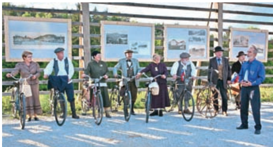
Utrinek z odprtja druge razstave v galeriji pod kozolcem v Žlebeh