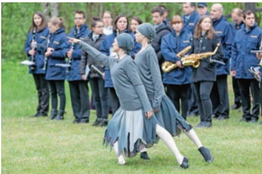
Program je povezal številna medvoška društva, organizacije in posameznike.