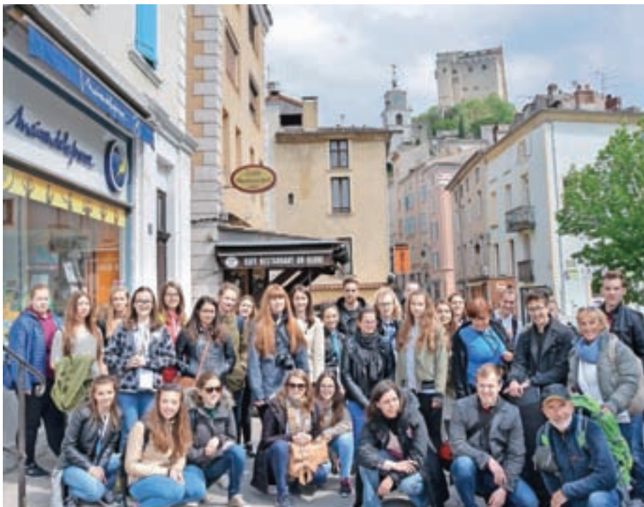
Medvoška delegacija po ogledu mesta Crest. V ozadju najvišji srednjeveški stolp v Franciji, po katerem se je dvajset članov delegacije spustilo z vrvo.

tovanje v tujini. Samo vzdušje na gostovanju je pokazalo, da mladi radi odkrivajo in spoznavajo druge kulture Evrope (in širše) in da nas takšno povezovanje krepi in dela močnejše tako kot posameznike kot tudi kot družbo. Mladi si želijo biti vključeni v procese in razprave o temah, ki se jih dotikajo, k temu pa jih spodbuja tudi povezovanje in sodelovanje med mladimi in manj mladimi Evropejci, saj le tako skupaj napredujemo.