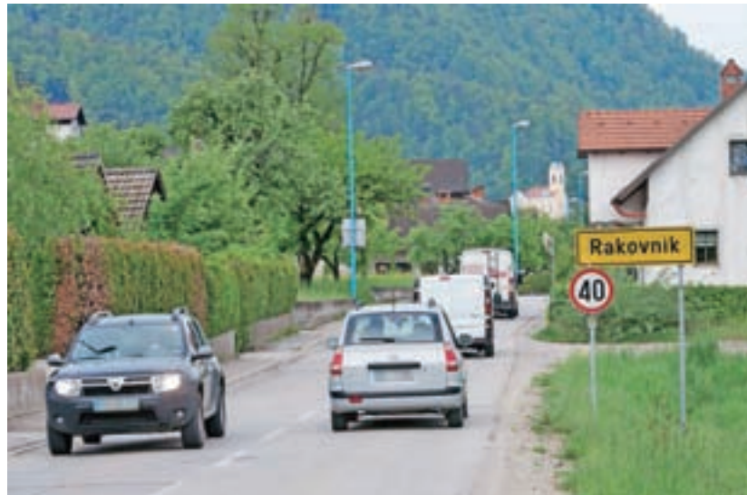
Veliko kršitev hitrosti so zaznali tudi v Rakovniku.

Poročilo vsebuje podatke po posameznih področjih: kriminaliteta, javni red in mir ter prometna varnost. Kot je dejal Strehar, se je na področju kriminalitete izredno povečalo število kaznivih dejanj zoper premoženje: "Kazniva dejanja so dokaj enakomerno razpršena po celotni občini. V porastu je kriminaliteta s področja vlomov v stanovanjske hiše predvsem v dopoldanskem in popoldanskem času ter v času praznikov in dopustov, ko so ljudje odsotni od doma. Pozval bi vse občane, da naredijo več za svoje premoženje s samozaščitnimi ukrepi. Vse sumljive okoliščine, ki jih opazijo v svojem okolju, naj sporočijo na policijo. Pomembno je, da do teh informacij pridemo. Preiskanih je bilo dobrih 42 odstotkov vseh kaznivih dejanj, razveseljivo pa je, da so bila preiskana vsa hujša kazniva dejanja." Kar se tiče javnega reda in miru so obravnavali več kršitev kot v letu 2015, in sicer 350. Zelo aktivni so bili tudi glede Cluba Seven v Pirničah (nekdanja Lipa), kjer so lani večkrat intervenirali in obravnavali prekrške. V sodelovanju z različnimi inšpekcijski-