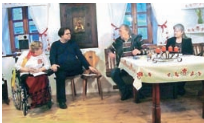
Letošnji Noči knjige so se pridružili tudi člani KUD JaReM. / Foto: arhiv KUD JaReM