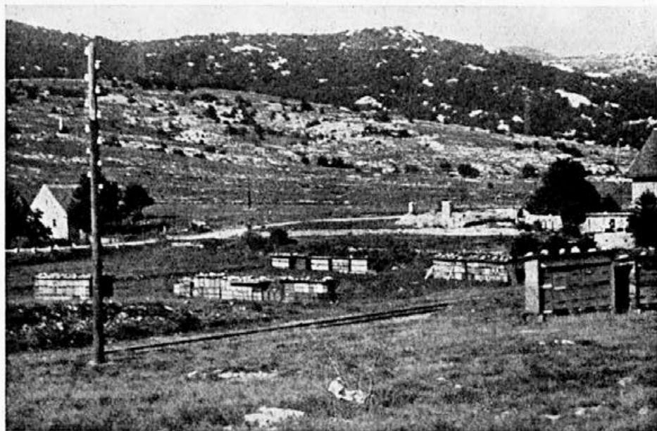
Panji slovenskih čebelarjev v Liki, kjer je odkupoval Medeks lani med kar na terenu

Podjetje oskrbuje s panji, satnicami in drugimi čebelarskimi potrebščinami vse čebelarje v Jugoslaviji. S prodajo AŽ-panjev, zlasti v druge republike, je znatno izboljšalo način čebelarjenja in proizvodnjo medu tudi