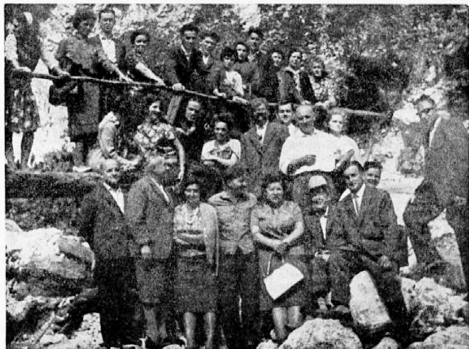
Podjetni litijski čebelarji s svojimi boljšimi polovicami na izletu v Logarski dolini