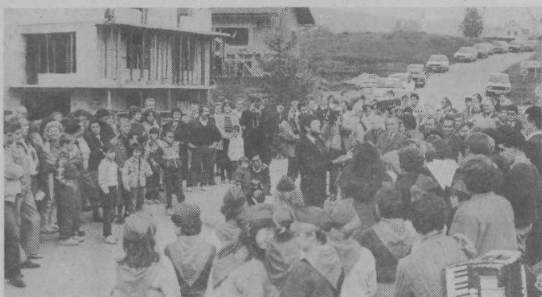
VIŠNJA GORA, 10. oktobra — Na slovesni otvoritvi obnovljenih cestnih odsekov Višnja gora — Peščenik — Kriška vas — Nova vas — Polževo — Zavrtiče so se zbrali krajin Višnje gore, predstavniki občine Grosuplje in izvajalcev del. Skupna dolžina novih asfaltiranih cest je 6550 metrov, kar je precejšnja pridobitev za KS Višnja gora.

Več kot tri četrtine dohodka gospodarstva občine sta ustvarili le dve področji: industrija (44%) in gradbeništvo (33%). Dohodek pa se je najbolj povečal v obrtni dejavnosti (IND 276), stanovanjsko-komunalni dejavnosti (IND 255) in trgovini (IND 246).