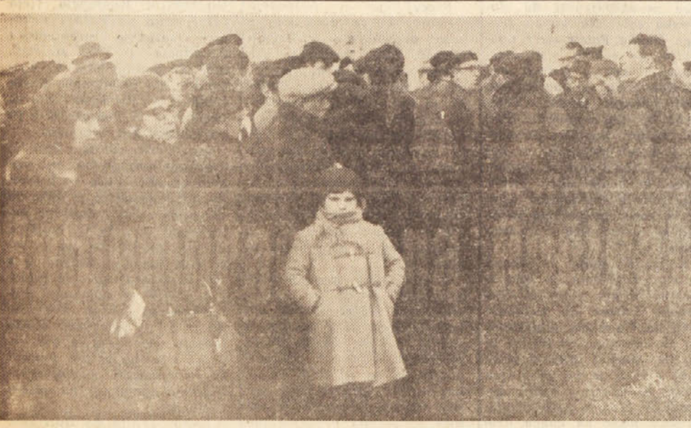
Pevski zbor Prosek-Kontovel poje žalostinko

(Nadaljevanje s 1. strani) Ves narod se je pripravil na ilegalni zahtev dne. Gnev in duh odpora je postal večji in večji.