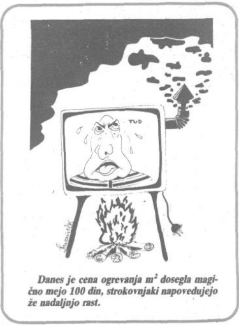
Danes je cena ogrevanja m 2 dosegla magično mejo 100 din, strokovnjaki napovedujejo že nadaljnjo rast.

Zaključek te razprave je bil zatorej, da se v mesecu dni pripravi natančna analiza problemov z izdelavo natančnih