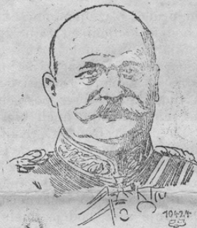
Generalob. von Eichhorn.

Uradno se poroča, da je bil generalni oberst v. Eichhorn vsled svojih zaslug kot vrhovni poveljnik 10. armade in za uresnič-