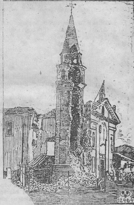
streljni stolp v Ponte di Piava na Italijanskem.

Prinašamo zanimivo sliko iz vojne na južnem zapadu. Slika kaže od Italijanov raz-