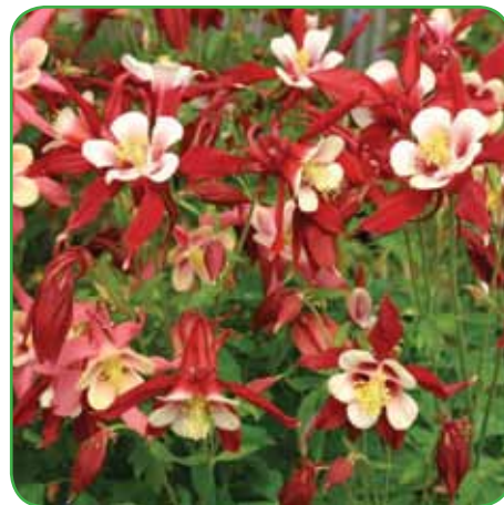
Orlica - nekatere sorte se tudi same razmnožujejo naprej

Trajnice za mokra tla nam pridejo prav tam, kjer veči-