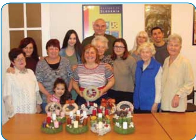
Členi društva z napravljenimi adventnimi vencí

spominjali, gda smo delali vejnce. Dosti vse smo si pripovedjali. Malo smo jedli pa nazdravili. Mi smo zdaj tó na žira krü pa lük djeli, kak prvin doma, prinesli smo domanji pokaraj pa domanja jabolka. Fajn smo se počutili.