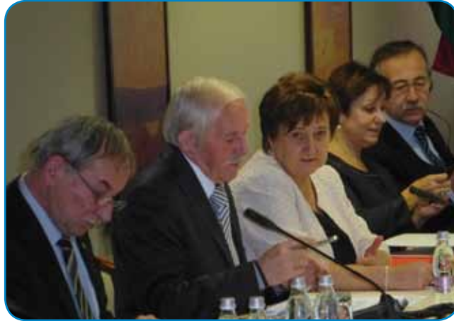
Porabski del članov mešane komisije na zasedanju

za regionalne projekte in povezave. Potrebujemo projekte in razvojno vizijo tudi na gospodarskem področju.»