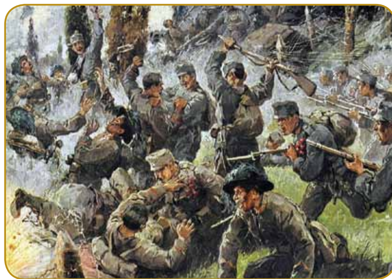
»Doberdob, slovenski pojbov grob« - na taljanskoj fronti je mrlau dosta vogrski slovenski sodakov tö

Cesar Franc Jožef je novembra 1916 mrau, na njegvo