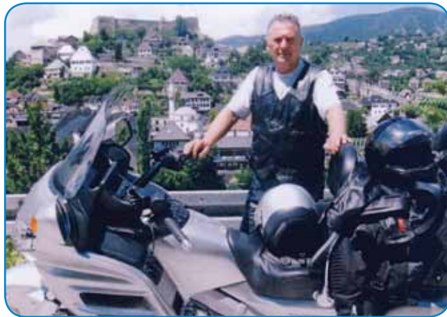
Rad se vozi z motoron

paverski šauli v Rakičani, vmes je napravvo ške trenerko vižgo za košarko in potistom je kak profesionalni