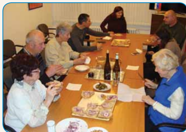
PRIPRAVLALI SMO SE NA ADVENT stran 5