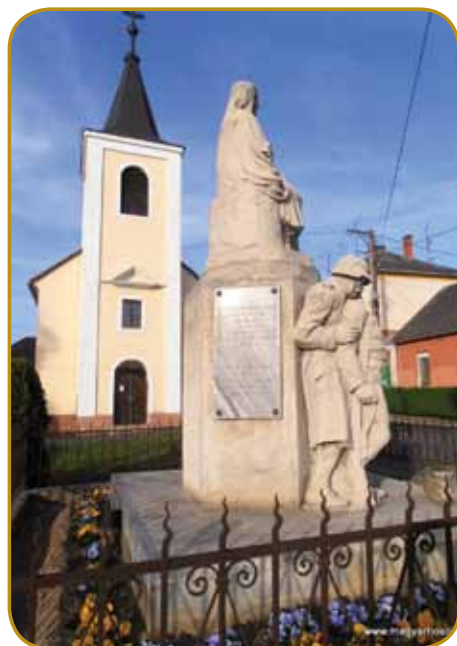
Spomenik pred kapejlicov v Slovenskoj vesi - stau lejt po bojni se eške itak spominamo

lestvo z antantnimi rosagi podpisalo tzv. »londonski pakt«, s šterim je zatajilo dogovore s centralnimi rosagi. Maja se je Italija obrnuala