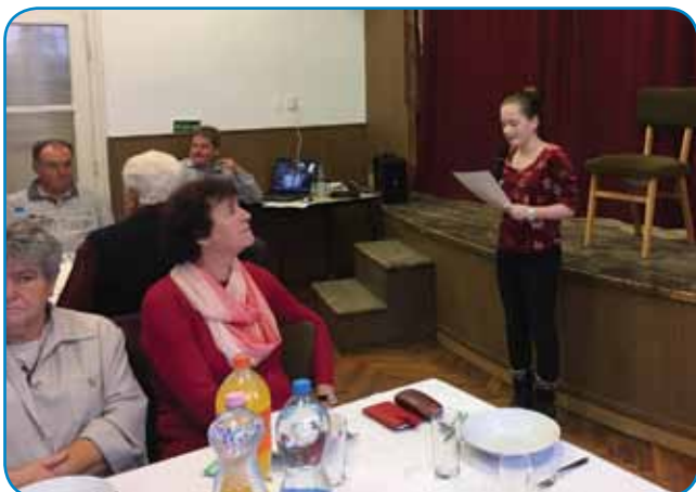
Starejše so pozdravili mladi pa občinski delavci

novam, ki so podprle prireditev. Uradu za razvoj zdravstva v Mo-