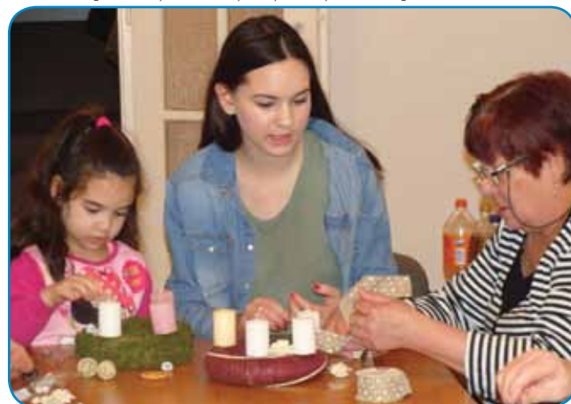
Babice so vküper delale z vnukicami

pa so kaj dobili, kakšne krajcare ali kaj drugoga. Dosta djajec so želeli, kak na pauti kamenje. Na Licijo nej-smo smeje šivati, ka prej kokaušom rit vküper zašijemo, pa nedo več jajc nesle. Gda je pa prišo sveti post (24. december) te je na den samo trikrat leko djo. Samo podne se je leko nadjo. Ka smo djeli? Pošüšene