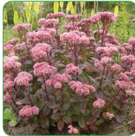
Hermelike so izjemno medonosne rastline, primerne tudi za šopke

koncu cvet. Želimo si, da bi bil vrt zanimiv celo leto, ne samo v spomladanskih in zgodnje-poletnih mesecih. Cvetov na spomlad je po vrtovih veliko, da ne rečem preveč. Poleti in