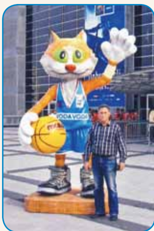
RAD SE POTEPA PO SVETI stran 4