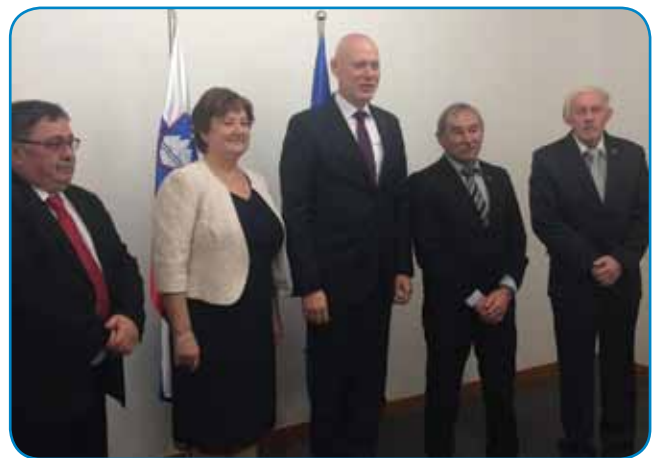
Srečanje s predsednikom državnega zbora Milanom Brglezom