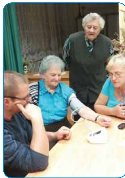
Če je stoj prosjo, so ma sodelavci Zdravstvenoga doma v Monoštri zmerili krvni tlak

slovenske samouprave. Posebe so mislili na tiste, ki so tau leto imeli okrogli rojstni den, sedemdesetoga, petinsedemdesetoga, osemdesetoga oz. na najstarejšo osebo v vesi. Nji so pozdravili z