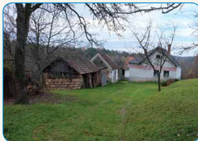
SAMO PERO PA PAPIR SEM MEJLA stran 8