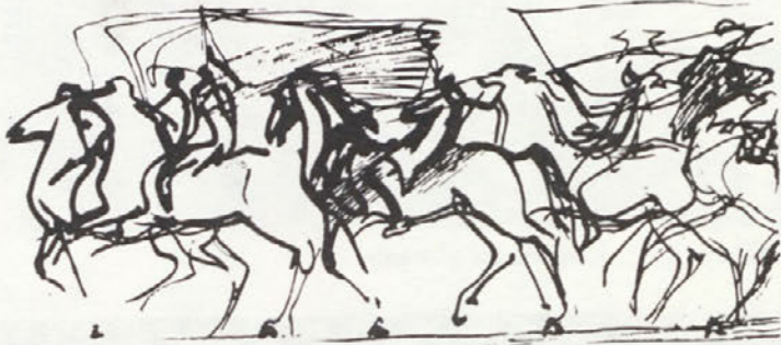
Ismet Mujezinović: risba