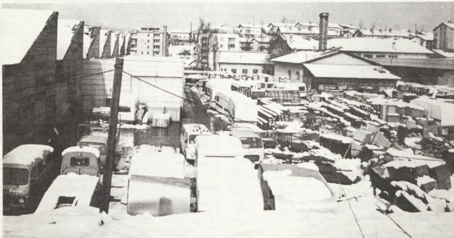
Novemberski sneg – prvi znanilec zime... Še bolj neusmiljeno je razkril prostorske stiske, v kakršnih se še vedno nahajamo, dokler ne bomo zgradili vseh predvidenih objektov, med njimi tudi skladišč.