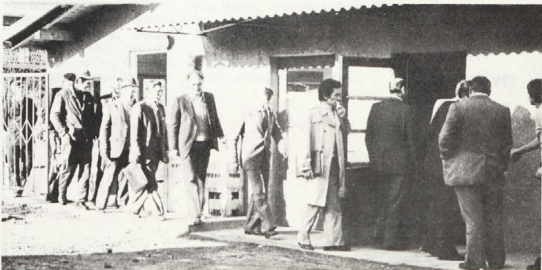
Ko so člani delovne skupine pri CK ZKS obiskali našo temeljno organizacijo združenega dela v Črnomlju, je tudi tu stekla živahna razprava.