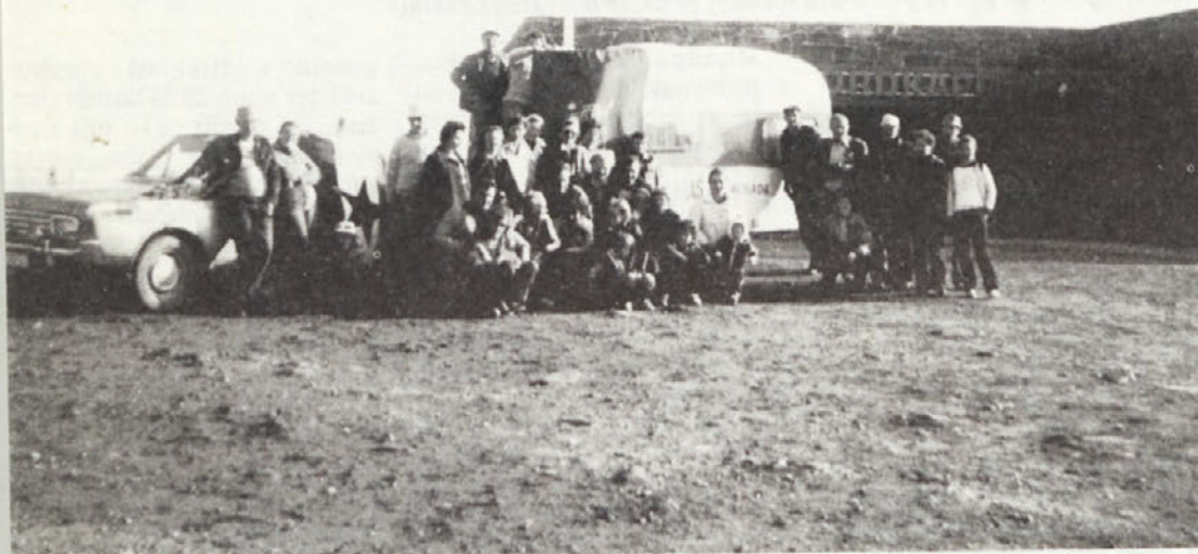
Naše prikolice na daljnjem evropskem severu – IMV Adria gre po svetu tudi v kraje, o katerih smo nekoč samo brali, da obstajajo. . .

Smatramo da bi prilikom sljedećih sličnih putovanja o tome trebalo voditi računa. Posebno moramo istaći slučaj u Stockholmu, kada je prvi i zadnji puta došlo do kvara na jednoj od prikolica. Nekoliko kilometara ispred kampa u Stockholmu došlo je do pucaanja kompletne poluosovine i tromla na „Adriji 450“, koju smo nekako uspješni odvući do kampa. Odmah sutradan smo nazvali AMSH u Zagrebu i javili za taj problem. Dalje je sve teklo kao u dobro režiranom filmu. AMSH je poslao telex u Novo mesto, vi u Stockholm do vašeg zastupnika, i prikolica je u roku od 3 sata bila popravljena. Odjek ovako uspješne suradnje i organizacije je došao i na švedski radio koji nam je ustupio jednu emisiju u trajanju (Nadaljevanje na 11. str.)