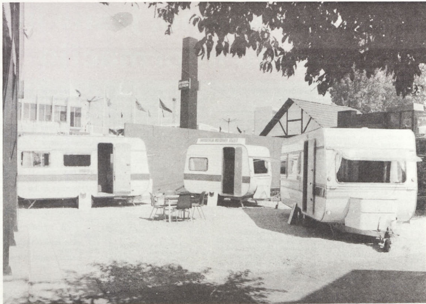
Na grškem trgu je veliko zanimanje za naše prikolice. Letos smo že šestič nastopili na mednarodnem razstavnem prostoru sejma v Solunu.