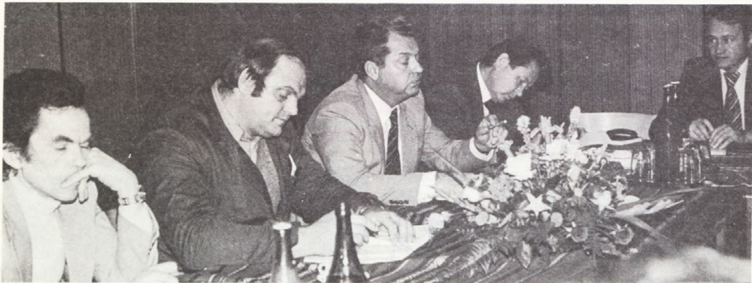
Z obiska delovne skupine pri centralnem komiteju Zveze komunistov Slovenije