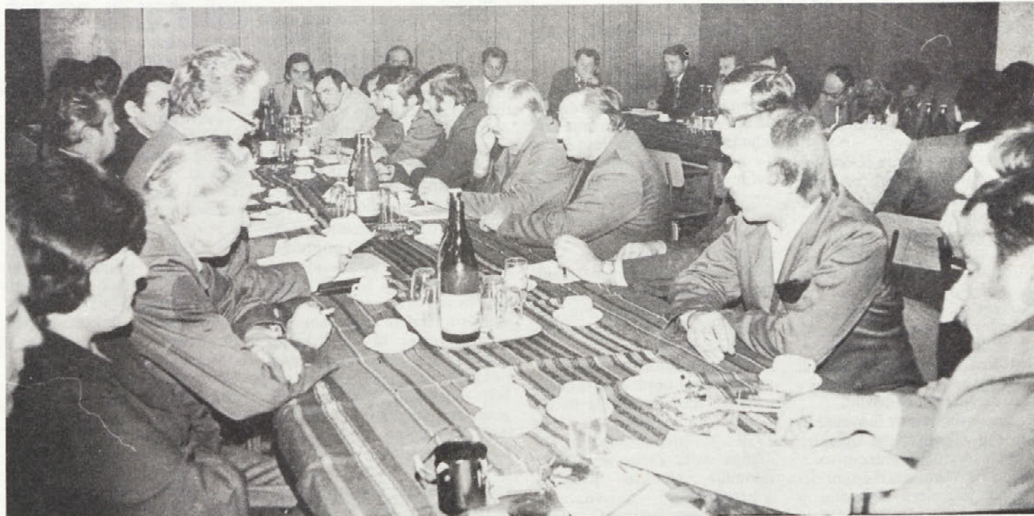
Člani delovne skupine pri CK ZKS na razgovoru v tovarni avtomobilov.

Zato je bila tudi na zadnji seji DS delovne organizacije sprožena pobuda za združitev vseh zdravih in pozitivnih tendenc, ki prispevajo k hitrejšemu gospodarskemu in samoupravnemu razvoju tozd in delovne organizacije. DS delovne organizacije IMV je že dosedaj na svojih sejah zavzemal stališča do vseh vprašanj, ki so se takrat zopet izpostavila kot kritična in nerazrešena.