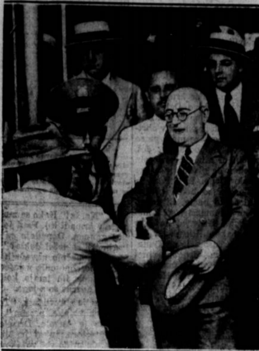
Znameniti poveljnik obrambe Madrida, general Jose Miaja, je po padcu republike odpoval iz sevornosti fašistične persekucije. Ustavil se je v par francoskih kolonijah v Afriki in končno prišel s svojo ženo na ameriško celino. Najprej se je ukrcal na Kubi. Njune štiri hčere in dva sina so prišli z njima. Njihov namen je ustanoviti si stalni dom v Mehiki.