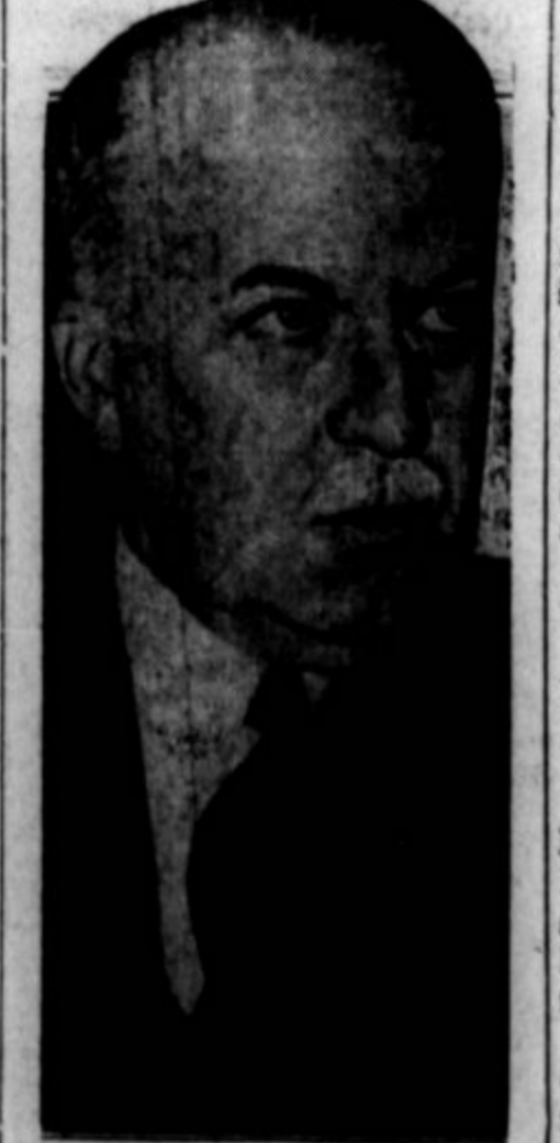
WALTER S. GIFFORD Vrh tega ima po nekaj tisočakov plače v raznih drugih korporacijah. Problem brezposelnosti se njega ne tiče in WPA lahko smatra za popolnoma nepotrebno ustanovo, kakor vsi taki, ki prejemaajo od par sto tisoč do milijon dolarjev plače na leto.