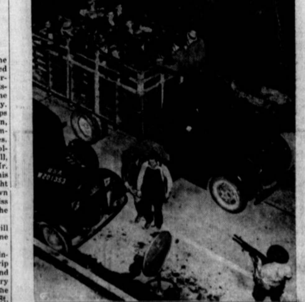
A truckload of picketing miners in Harlan, Kentucky, being sent to a Harlan jail, at the point of national guardsmen's guns.