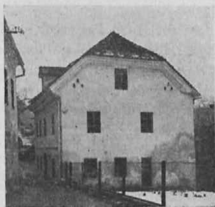
Prvi lastni dom »na Skali«.

Leta 1951. je pa bila izvršena povečava Skale. Združeni sta bili obe hiši prav posrečeno. »Naš dom« je dobil lep prizidek in sodobno je bila urejena tudi dvorana. Prosneto društvo je za opremo dvorane izročilo dobiček, ki ga je naredilo v petih letih z najeto gostilno, nekaj je prihranila konferenca in priskočila je na pomoč tudi domača hranilnica, pa so bili ravno pred zaporo de-