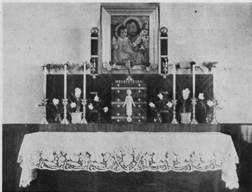
Novi oltar v kapelici na Skali.

Petdeset let je doslej Vincencijeva konferenca lepo delovala. Pot ji bo pač tudi v bodočnosti za delo na široko odprta. Naj jo blagoslavlja Bog na priprošnjo Marije in sv. Vincencija Pavelskega!