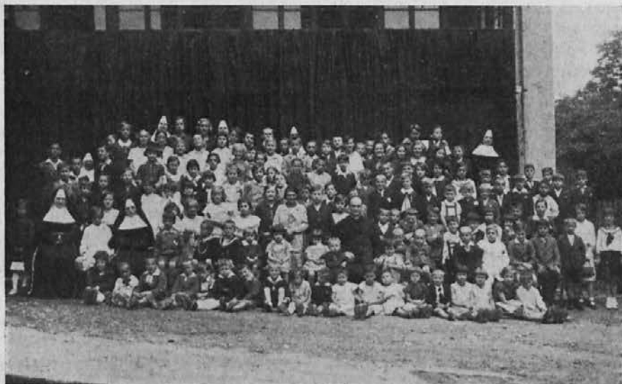
Vsako jesen se napolni Skala.

kvi pri vseh treh svetih mašah. Nov način naj užge našo novo ljubezen za dobro stvar! Tudi pri šmarnicah ob nedeljah in praznikih bo pobiral cerkovnik v ta namen s pušco. Kdor bo daroval v plemeniti namen, bo posnemal Barago in njegovo ljubezen za resnične potrebe. Naj nam bo v tem Baraga učenik! Saj s tem poslušamo božji in Baragov klic: »Le eno je potrebno!«