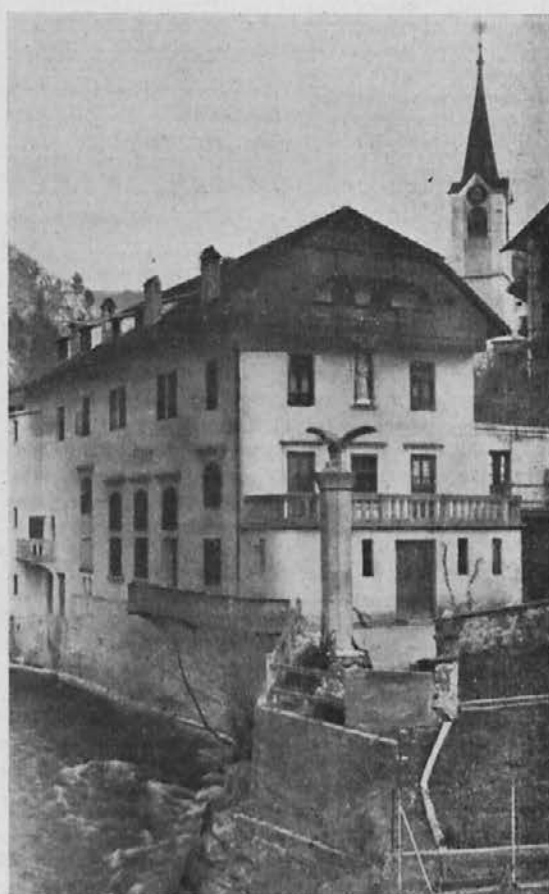
Sedanji lastni dom »na Skalici«, ki je v ospredju zvezan s prvotnim.

Tudi v tržiški župniji je bila pred 50 leti ustanovljena Vincencijeva konferenca. Pač zato, da se je sklanjala že doslej pet desetletij k vsem potrebnim in da je skušala biti lučka v ljubezni