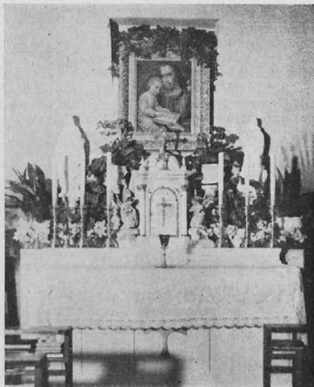
Prejšnji oltar sv. Jožefa v kapeli na Skali.

narja plačani vsi stroški v znesku din 429.754,15. Hvala Bogu, izvršeno je bilo s tem veliko delo. Blagoslovitev prizidka se je vršila 15. novembra 1951.