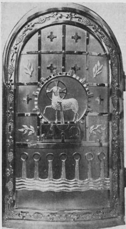
Nova vrata tabernaklja v Trziču.

s svojim prispevkom pri tako lepi stvari, naj se oglasi še isti dan. Povedal je tudi željo pozlatarja po kakšnem ceki- nu, ker je v teh najboljša snov za pozlatenje. Z velikim veseljem so se mnogi odzvali. Preko mere se je nabralo da-