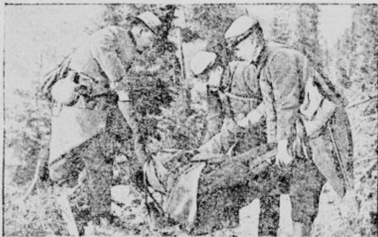
Francoski vojaki pomagajo ranjenim tovarišem.

vsako popoldne obiskuje ranjence v lazaretu Santa Marta. Iz vatikanske knjižnice