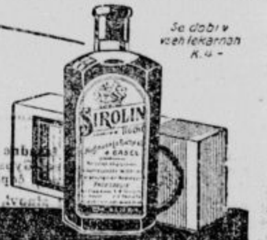
Se dobi v vseh lekarnah K. 4-