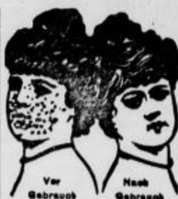
Vor Gebrauch Nach Gebrauch

Chem. Pharm. Laboratorium KARL REMMEL, Lan- hut 109, Bavarako. 9773 95 10