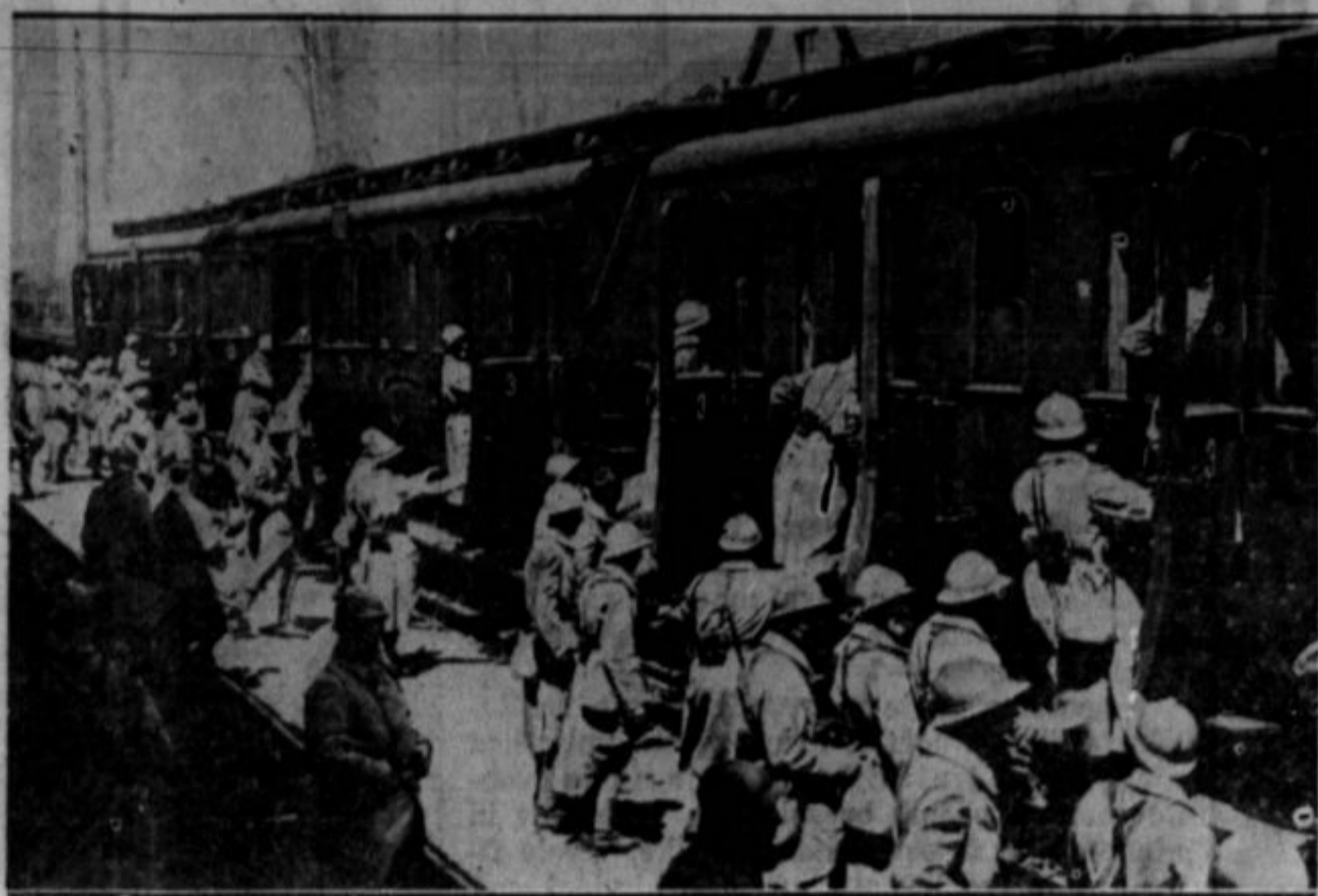
Francija, ki je v neprestanih vladnih krizah in v silovitem boju med levico (ljudsko fronto) in desnico (strankami kapitalistične reakcije), je enotna fronta le v enem: da mora biti pripravljena na neizogibno: na vojno. — Oborožuje se skoro z enako naglico kakor Anglija. Francija je bila sicer prej dobro "pripravljena", toda Nemčija jo je nadkrčila, in zdaj jo hoče dohiteti in prekositi. Na sliki so francoski vojaki, poslani na manevre ob nemški in italijanski meji.