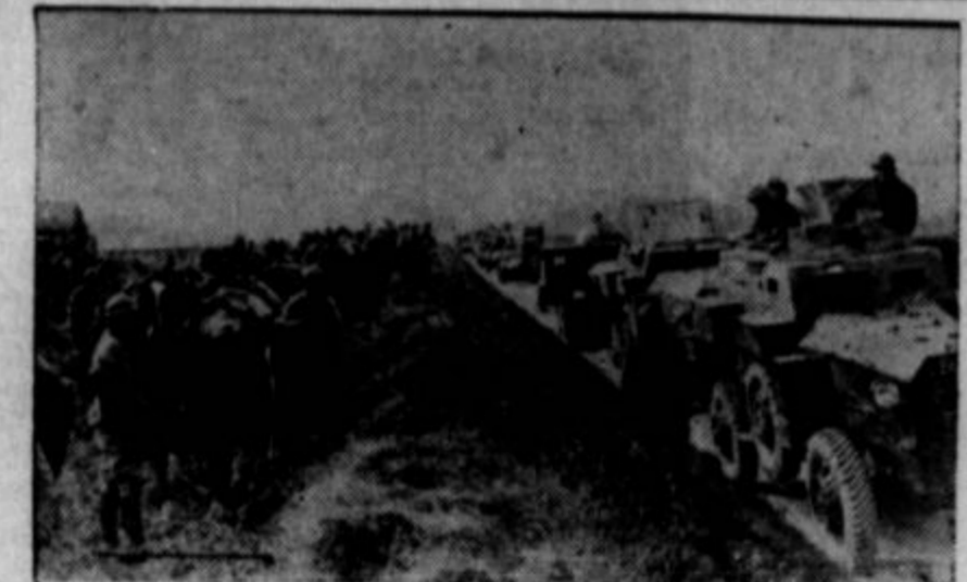
Mussolini je na urgiranje angleške vlade nedavno izjavil, kako in kaj o italijanskih "prostovoljcih" v Španiji. Pozval bo nazaj vse svoje vojake ("prostovoljce") — toda ne prej dokler Franco ne zmaga. Premier Neville Chamberlain je baje pristal v ta pogoj in tako je španska republika žrtvana — v prid angleškemu imperializmu, ki se noč in dan ponaša z demokracijo.