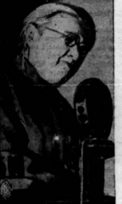
ALEKSIJ RIKOV, po Leninovi smrti deset let predsednik sovjetske vlade. V zadnji obravnavi je bil obsodjen v smrt in ustreljen.

Masne obravnave in smrtno obtožbe proti ljudem, ki so izvršili boljševoško revolucijo in jo potem vodili od deset do petnajst let, dokler niso bili pometani v ječo in obsodeni v smrt — mnogi so bili ustreljeni brez obravnave — pa je na obetano svetlo demokratično vrglo čudno luč. Možno je, da so bili obsodenci nespodobni za naloge v novih razmerah — kajti bili so poklicni revolucionarji. Možno, zelo možno je, da jih je sedanjí režim enostavno zavrgel, ker so mu postali v napotje. "čistke" v tako velikem obsegu, kot se vrše v Rusiji, v zgodovini