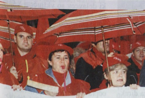
Dekleta so se potrudila s piščalkami.