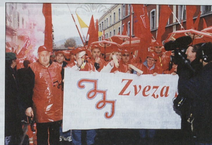
Televizijske ekipe so nas snemale po vsej poti.

Po temeljitih pripravah na eni in drugi strani barikad so se demonstracije nekaj po poldnevu začele. Nepregledna množica demonstrantov je krenila na dolg večurni pohod po ulicah Nice, kjer so jih izredno toplo in naklo-