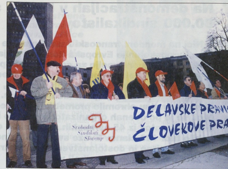
V petek, osmega decembra, so točno ob dvanajsti uri predstavniki ZSSS pred državnim zborom opozorili na spoštovanje človekovih pravic.