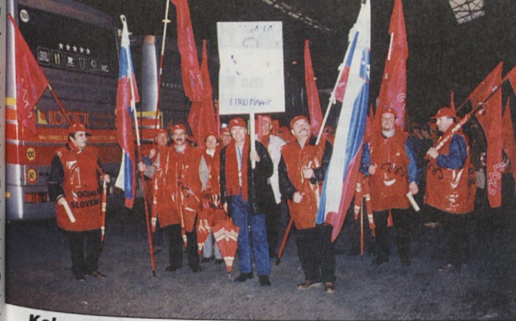
Kolono smo oblikovali na stari avtobusni postaji.

Že nekaj kilometrov pred Nico so dobili avtobusi z demonstranti policijsko spremstvo – dva motorizirana policista spredaj in eden zadaj (vsak avtobus je do-