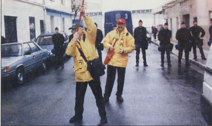
Doro in Stane sta tako pozdravila specialce.