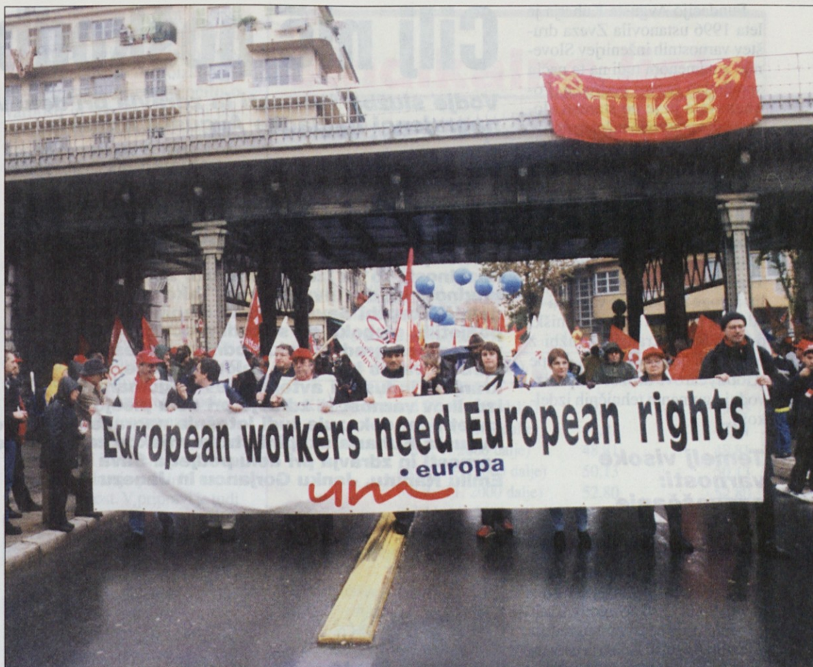
Med najlepšimi gesli je bilo – evropski delavci potrebujejo evropske pravice.