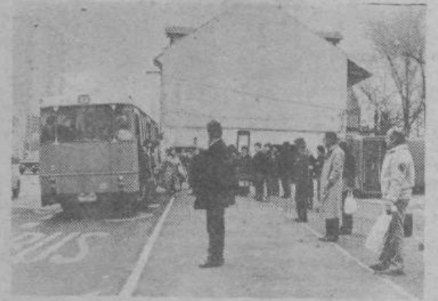
Z ureditvijo postajališča mestnega potniškega prometa nasproti stavbe občinske skupščine je center Most dobil lepšo podobo, obenem pa bodo pešci varnejše kot doslej prečkali prometno Zaloško cesto, saj nevarnega prehoda tik pred postajališčem ni več.

novim letom bo sicer še naprej poslovalo kot klub zaprtega tipa, le da bo redno zaposlilo natakarič, ki bo članstvu lahko hitreje postregla.