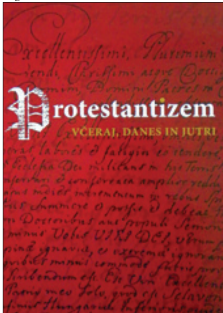
Naslovnica Zbornika referatov Protestantizem - včeraj, danes in jutri