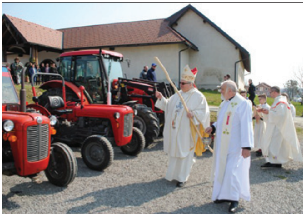
Blagoslovitev traktorjev v Markovcih

Dejan rad dela z ljudmi in za ljudi. Povedal je tudi to, da se ukvarja z živinorejo s kmetijstvom in tudi na tak način se približuje ljudem.