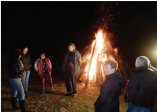
Pri ognji (kresu) se je fajm bilau segrevjati

Porabsko kulturno in turistično društvo Andovci zdaj se že deset lejt trūdi na tejm, aj se ta stara šega ne pozabi pa aj kak največ Slovincov stoji kauli ognja na velko soboto. Kak vsakšo leto, zdaj smo tō po meši