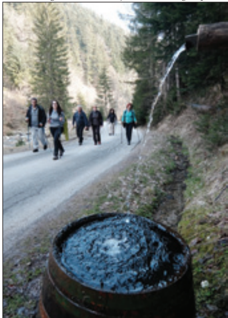
Tü smo eške po asfalti šli

Člani Porabskega kulturnega in turističnega društva Andovci smo si tak zmislili, ka mo na vüzenski pondejlek malo trenerali na triglavsko romanje. Kak