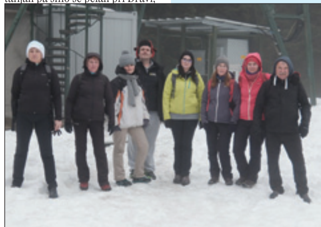
Pri stolpi na Rogli

smo proti Dravograda vsigdar vekše brgauve zaglednili, dapa mi smo s tejmí nej bili zadovolni, kak tau šegau ma biti. Poiščemo enga bola višešoga, smo pravli