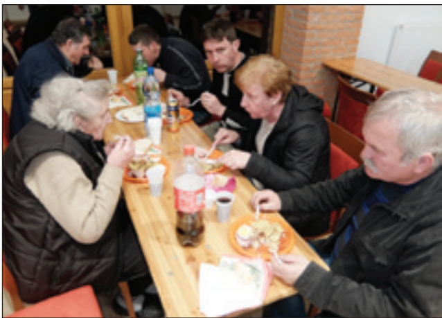
Večerja na velko soboto: šunka, jajca pa krumči na tikvinom olji

vožgali ogenj pri Porabskoj domačiji. Drva, kak vsigdar, smo zdaj tō predpodnevom pripelali, zato ka smo mi čedni, etak se ne zmocajo, pa nej je trbej pokrivati. Te siuje drve so tak fejest sagrevjale, ka sprvoga smo nej mogli paulek ognja titi, samo vō na okno smo gledali, kak gori. Dapa tau nej bila baja, zato ka te čas smo ranč leko podjeli šunko, štero so nam v Števanovci v cerkvi posvečali. Tak je bilau, ka šunka, djajce pa krumči na tikvinom olji baudejo za večerjo, dapa Šanji Matuš so nas presenetili. Dva velka, žmana pereca so nam prinesli. Gda smo