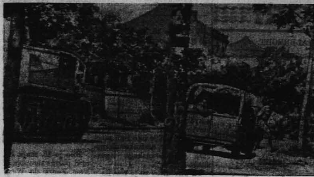
Ameriški vojaki zbirajo italijanske vojne ujetnike v Tuniziji.

V teden dni trajajoči bitki so sodelovale britske in kanadske korvete ter različne druge ladje, ki so spremljale konvoj. Ta zmaga nad podmornicami se smatra za eno največjih posejdnih zavezniških zmag te vrste na morju.