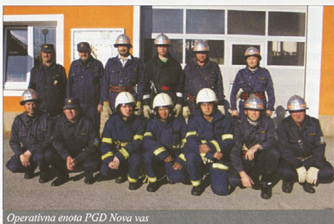
Operativna enota PGD Nova vas