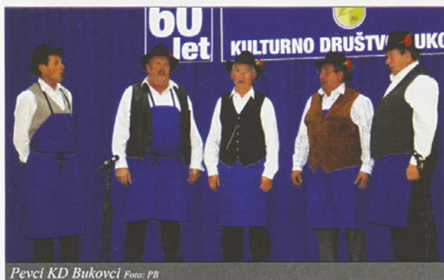
Pevci KD Bukovci

V soboto, 4. decembra, smo se v kulturno-športni dvorani zbrali na proslavi ob 60-letnici delovanja Kulturnega društva Bukovci. Uvodoma so nam zapeli pevci našega društva.