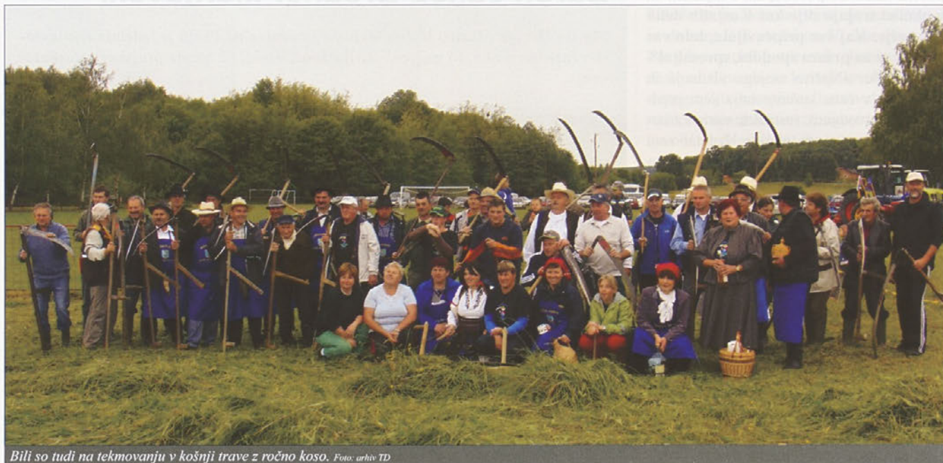
Bili so tudi na tekmovanju v košnji trave z ročno koso.

Ob deseti obletnici delovanja Turističnega društva občine Markovci smo pripravili slavnostno sejo, na katero smo povabili svoje člane in številne goste. Pregledali smo nastanek in razvoj društva skozi deset let delovanja in svoje delo predstavili s priložnostno projekcijo slik in razstavo. Na prireditvi smo se društvom in posameznikom, s katerimi sodelujemo, zahvalili za pomoč na prehojeni desetletni poti, nato pa se zadržali na kratkem druženju ob pogostitvi.