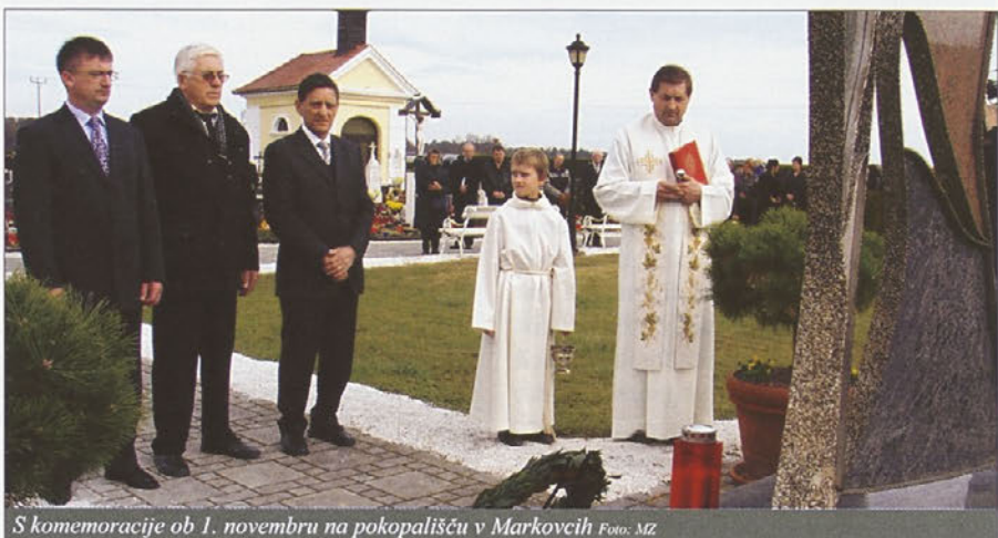
S komemoracije ob 1. novembru na pokopališču v Markovcih