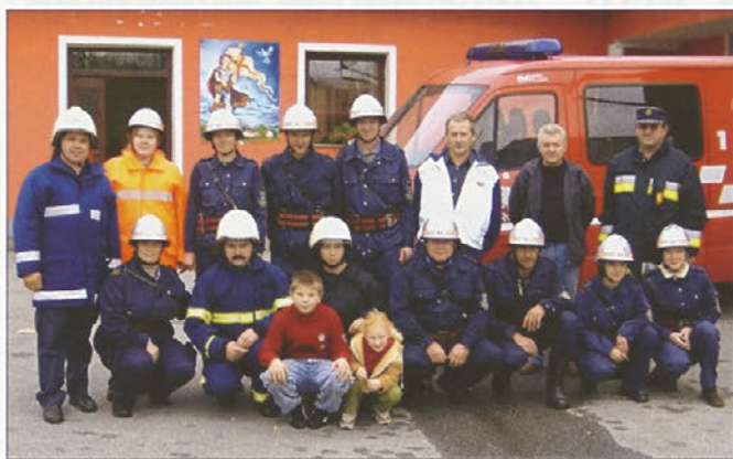
Operativna enota PGD Borovci