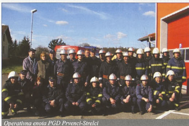
Operativna enota PGD Prvenci-Strelci