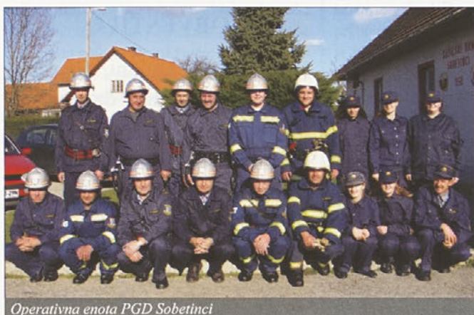
Operativna enota PGD Sobotinci