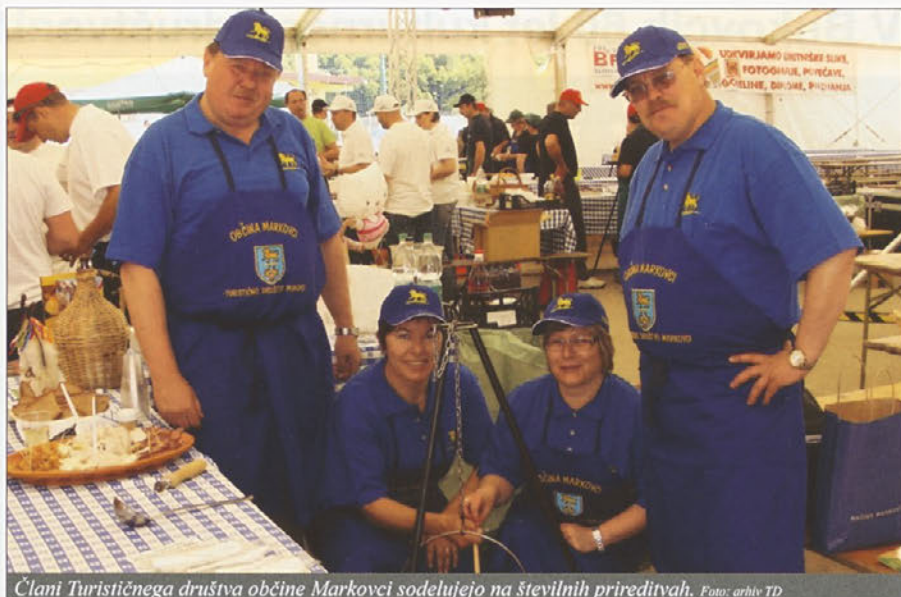
Člani Turističnega društva občine Markovci sodelujejo na številnih prireditvah.