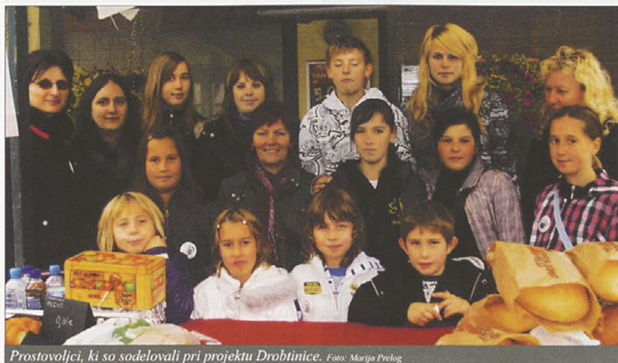
Prostovoljci, ki so sodelovali pri projektu Drobtinice.

16. oktober 2010 smo obeležili kot svetovni dan hrane. Na ta pomemben dan se je naša Občinska organizacija Rdečega križa odzvala tako, da smo se njeni člani pridružili vseslovenskemu projektu Rdečega križa »Drobtinice ob svetovnem dnevu hrane«.