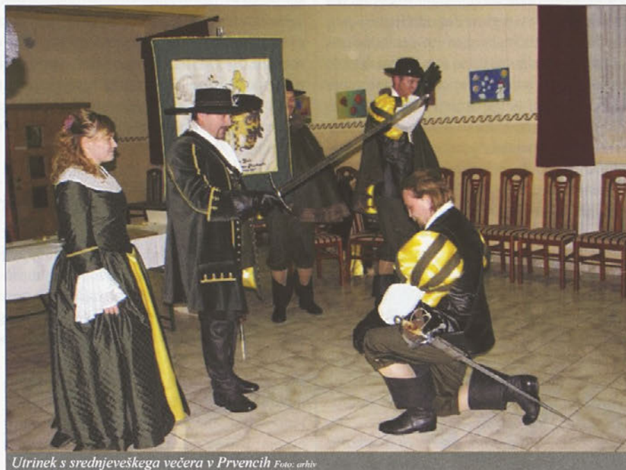
Utrinek s srednjeveškega večera v Prvencih

Kakšni so načrti vašega delovanja v času