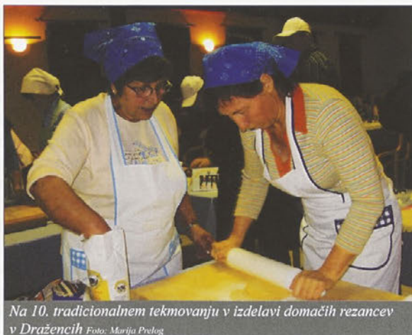
Na 10. tradicionalnem tekmovanju v izdelavi domačih rezancev v Dražencih.

Vse ekipe so se zelo dobro odrezale, tako da je ocenjevalna komisija imela resnično zahtevno delo. Društvo gospodinj Draženci pa je, kot že vsa ta leta, tudi letos pripravilo zanimivo razstavo, letos na temo žit in moke. Razstavljeni so bila različna žita (ajda, ječmen, koruza, oves, pira, proso, pšenica, tritikala in žito), predstavljene so bile moke iz teh žit in tudi različni kruhi (ajdov, čebulni, ječmenov, koruzni, ovseni, pirin, pšenični, rižev, rženi). Narejeni pa so bili tudi manjši vzglavniki iz ajdovih luščin. Prav tako so bili na ogled različni rezanci (domači za juho, ajdovi, pirini, koruzni, špinačni, korenčkovi, kakavovi, z rdečo peso, s poprom, zeliščni). Izdelki so bili zelo lično razstavljeni,