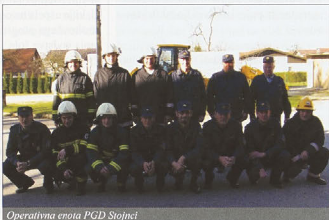
Operativna enota PGD Stojnci