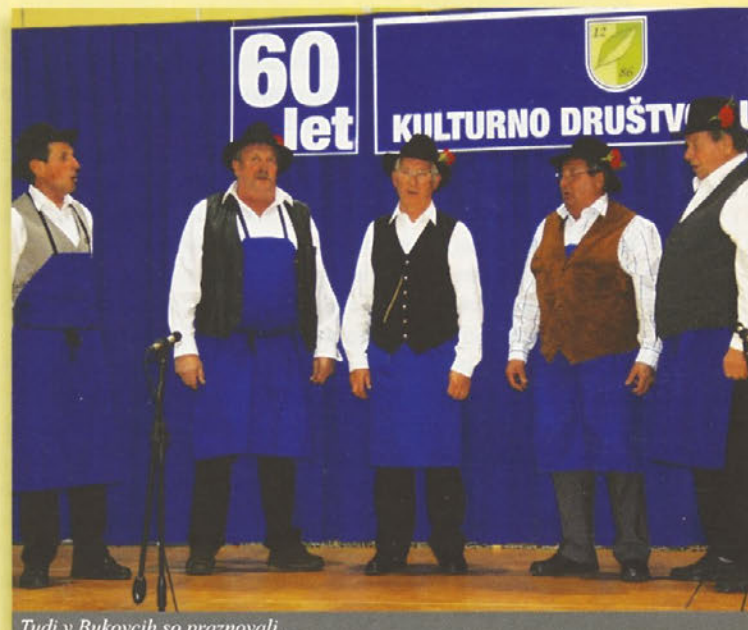
Tudi v Bukovcih so praznovali.