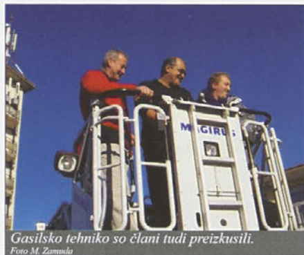
Gasilsko tehniko so člani tudi preizkusili.

6. novembra smo se gasilci in gasilke iz Borovcev odpravili na strokovno ekskurzijo. Ogledali smo si poklicno gasilsko brigado v Mariboru.