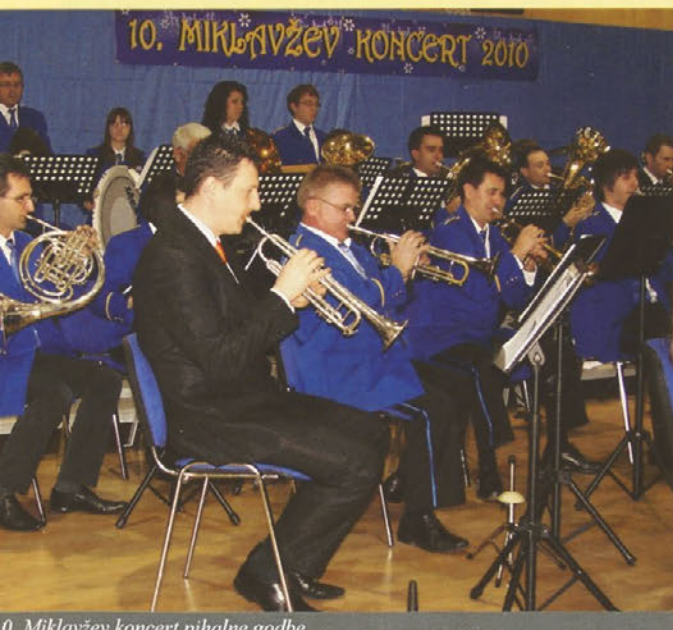
10. Miklavžev koncert pihalne godbe