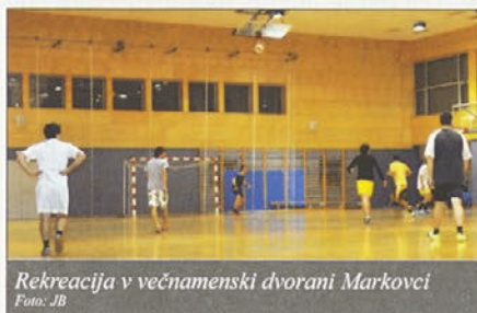
Rekreacija v večnamenski dvorani Markovci

Snežna odeja je prekrila nogometne zelence, kar pa ne pomeni, da se nogomet ne bo igral.