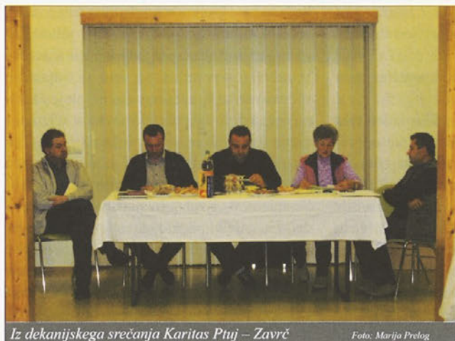
Iz dekanijskega srečanja Karitas Ptuj – Zavrč