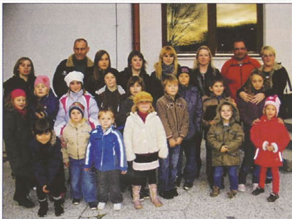
Markovski otroci na lutkovni predstavi v Zavrču.

kal tudi kviz za mlajše in starejše pionirje ter mladince.