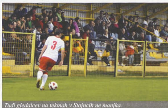
Tudi gledalcev na tekmah v Stojncih ne manjka.

V klubu so zelo ponosni, da so lahko sodelovali na nivoju krovne nogometne organizacije UEFA. Vendar povsem zaslužno, saj so si gostovanje turnirja prislužili s tr-