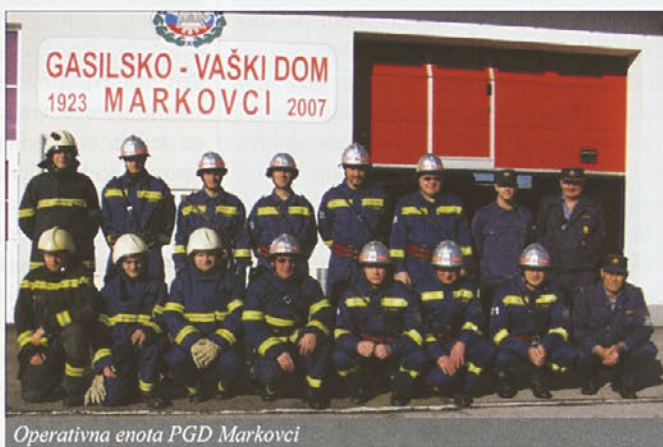
Operativna enota PGD Markovci