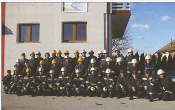
Operativna enota PGD Bukovci