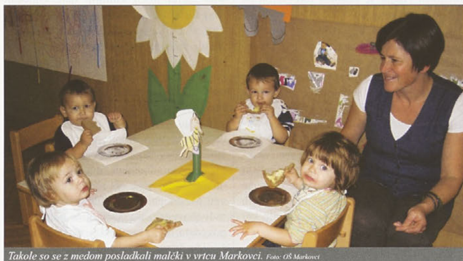
Takole so se z medom posladkali malčki v vrtcu Markovci.