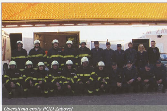
Operativna enota PGD Zabovci