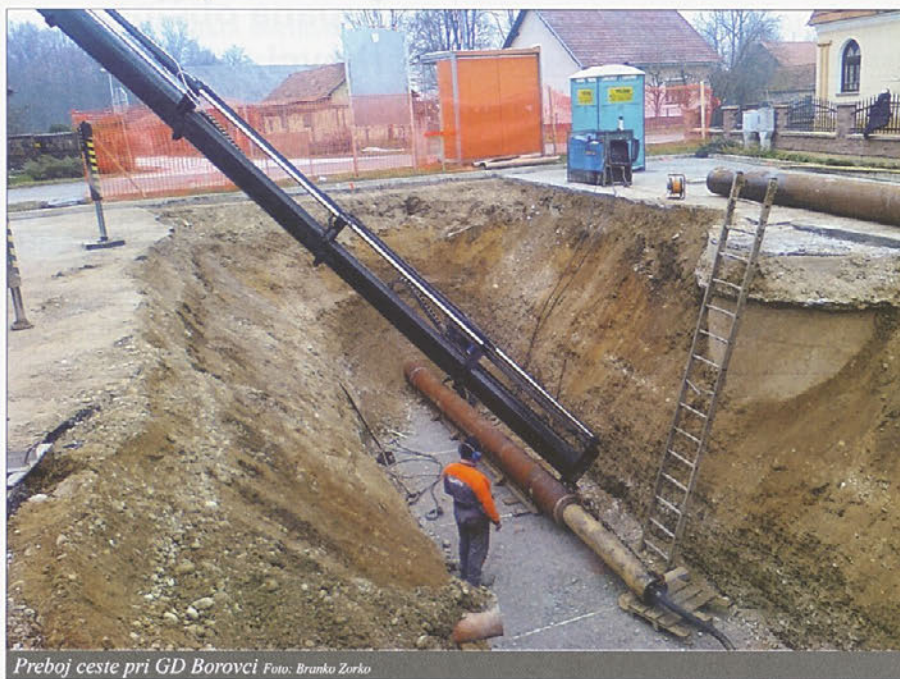
Preboj ceste pri GD Borovci

Izgradnja kanalizacije v naselju Borovci v zaključni fazi; izgradnja sekundarne kanalizacije v naselju Stojnci za terminskim načrtom; pridobivanje sredstev za sofinanciranje projekta izgradnje kanalizacije v naselju Sobotinci z dograditvijo obstoječe čistilne naprave.