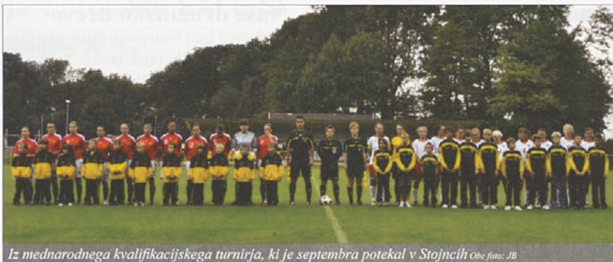
Iz mednarodnega kvalifikacijskega turnirja, ki je septembra potekal v Stojncih.

Leto 2010 je bilo za NK Stojnci zelo pestro. V športnem parku Stojnci so kar hitro po zimskem premoru umetno zelenico napolnili nogometaši. Tokrat so s turnirjem, posvečenim prazniku občine Markovci, sezono odprli najmlajši in najstarejši