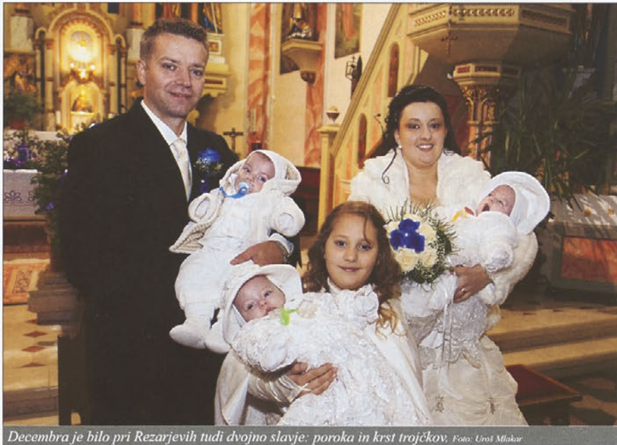
Decembra je bilo pri Rezarjevih tudi dvojno slavlje: poroka in krst trojčkov.

Sodelavke župnijske Karitas in članice OO RK so obiskale petčlansko družino Rezar iz Stojncev. Njihova najstarejša hči Larisa obiskuje tretji razred, avgusta pa so družino razveselili še trojčki, o čemer smo poročali že v prejšnji številki našega časopisa. Srečna družina uživa ob napredku trojčkov, predvsem pa v tem, da so zdravi in da jih lahko v sončnem vremenu z vozič-