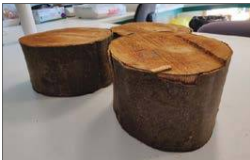
Slika 1: Koluti bukve, uporabljeni za proces umerjanja rezistografskih gosto.