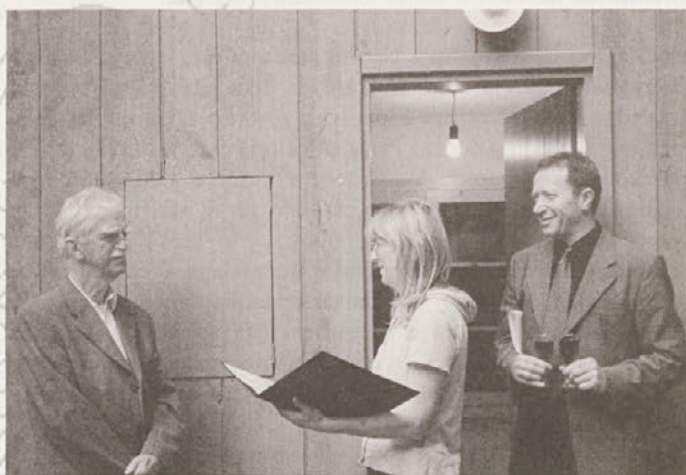
SED je bogatejši za novega častnega člana.