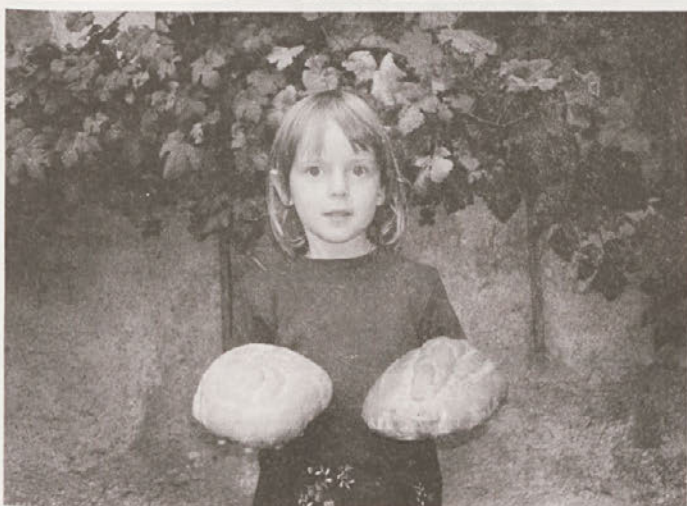
Po kruhu diši.