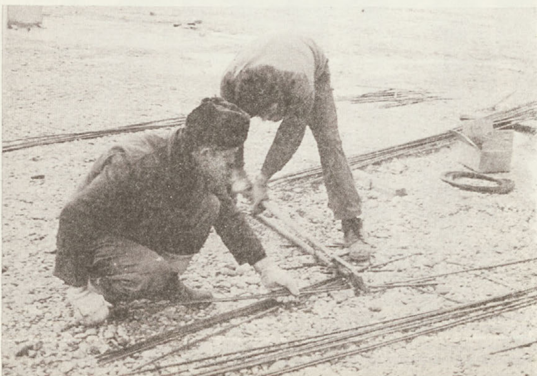
Železokrivca pri delu Armirača na poslu