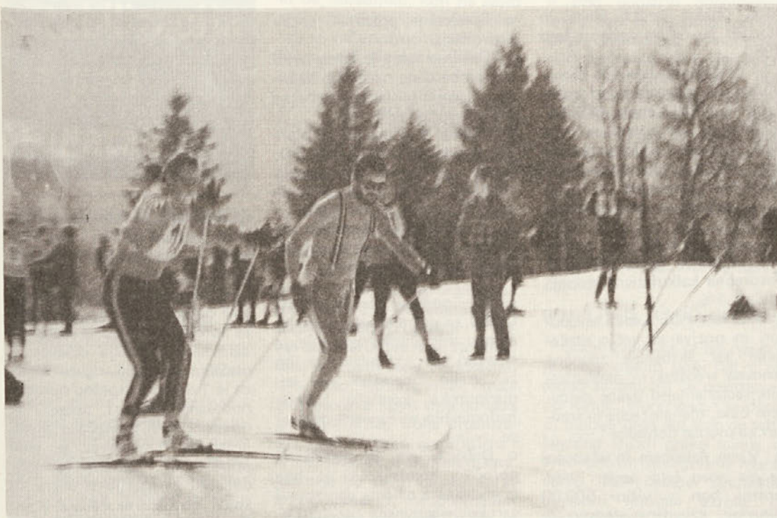
Dva naša smučarja veterana se ogrevata pred tekmovanjem Dva naša skijaša veterana za vreme ogrijevanja prije takmičenja

so prikazali zavidljivo raven tekmovalnega znanja in uspešno premagovali strme terene.