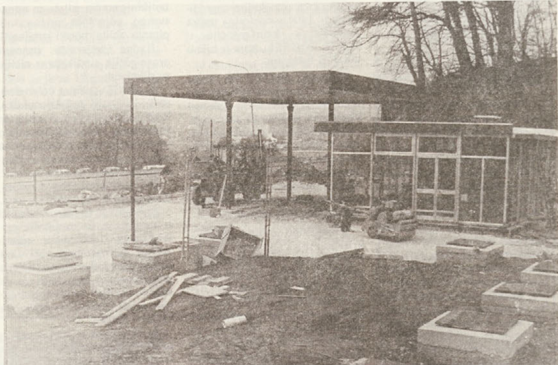
Gradnja nove Petrolove bencinske črpalke ob Ljubljanski cesti v Novem mestu Gradnja nove bencinske pumpe na Ljubljanskoj cesti u Novom mestu

mnogo više! Ako upotrijebiš kladu umjesto 5-puta, kao što je po normativu, 7-puta, uštedio si 40 posto vrijednosti bez nekih posebnih napora! Iste konstatacije vrijedi i za oplatu i za skele. Sijunak i pijesak su sirovine, koje se dobijaju za novac, zato ih ne treba rasipati. Svaki uštedeni kubik pijeska, sitnog pijeska, šljunka, je novac! Ne treba načinjati novul vreću cementa zbog lopate, koja ti je potrebna, potraži razasuti i najprije njega upotrijebi! Takve i slične mjere već smo uveli na našim gradilištima i na njima ćemo i nadalje odlučno ustrajati!