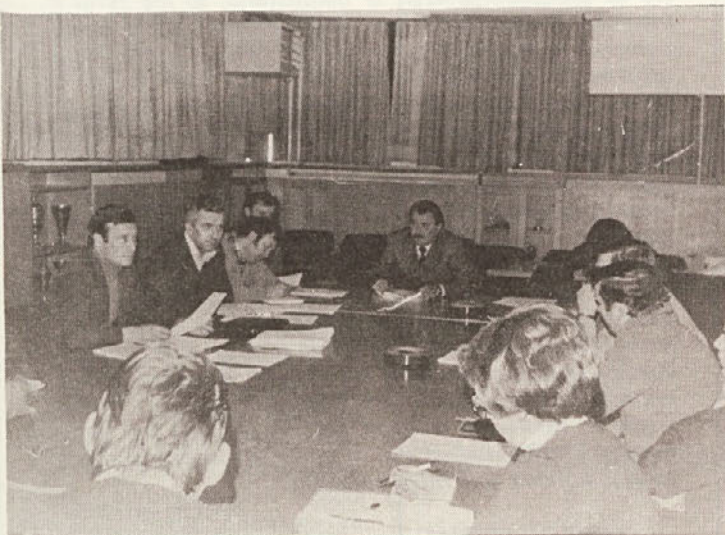
Med občnim zborom Konference sindikalnih organizacij SGP PIONIR Zasjedanje opčnega zbora Konferencije sindikalnih organizacij SGP PIONIR