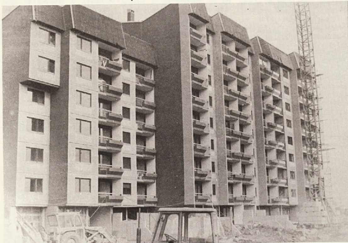
V stanovanja v objektu B-1 ob Cesti herojev so se v lamelo A in B (skupaj 59 stanovanj) prve dni januarja letos že vselili stanovanjci. Kljub veliki zamudi ob začetku del, je bila stavba dograjena v roku, za kar zasluži gradbeništvu vso pohvalo. U stanove u objektu B-1 na Cesti heroja su u lamelo A in B (skupa 59 stanova) prve dane januara uselili stanari. Usprkos zakašnjenju u početnim radovima, stanovi su bili dogradjeni na vreme i valja gradilištu čestitati

Ob skrbi za delavca ne gre samo za OD, gre tudi za standard. Temu vprašanju smo v zadnjih letih posvečali veliko pozornosti: zgradili smo nove samske domove v Ljubljani, Krškem, na Reki, v Novem mestu, uredili smo samsko naselje v Zagrebu in pripravljamo tam tudi gradnjo samskega doma in še enega samskega doma v Novem mestu. Skupaj s kulturnim in športnim delom za zaposlene, so vse našete dolgoročne naložbe v delavca in njegovo počutje in sem bomo morali dajati tudi vnaprej.