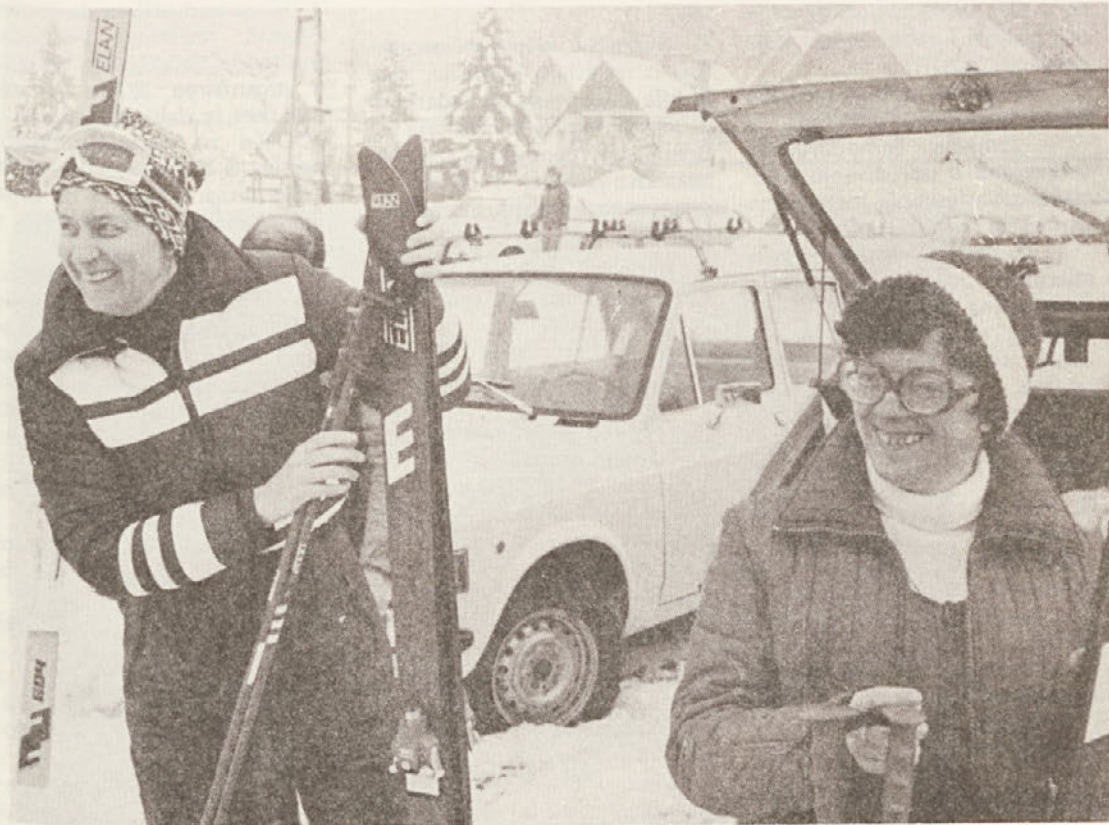
Nasmeh na obrazih priča o dobrom raspoloženju, sicer pa na Zimskom športnem dnevu ne gre za točke za svetovni pokal...