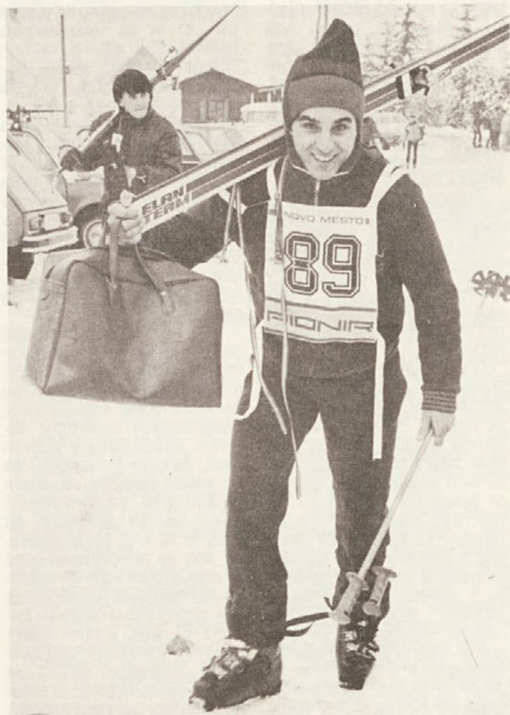
S polno torbo in nasmehom na obrazu pogumno na start na Zimskem športnem dnevu Se punom torbom i osmehom na licu junački na start na Zimskom športnom danu

Do konca januarja bo treba prijaviti skupni dohodek občanov za odmero ustreznega republiškega davka. V sloveniji bo takih prijav letos še znatno manj kot lani, saj bo znašal neobdavčeni skupni dohodek občana 248.000 din. Ljudi s tako visokimi skupnimi mesečnimi prejemki bo v Sloveniji verjetno le še nekaj tisoč. Za vzdrževanega družinskega člana se je v Sloveniji meja pomaknila medtem na 41.000 dinarjev oz. na 61.000 din, če občan vzdržuje duševno ali telesno motnega a26, na 41.000 dinarjev oz. na 61.000 din, če občan vzdržuje duševno ali telesno motnega otroka.