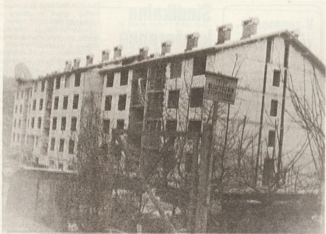
Novi samski dom v Bršlinu v Novem mestu že dobiva svoje končno podobo, na njem pa že potekajo obrtniška dela. Novi samski dom u Bršlinu u Novem mestu več dobiva svoj konačni oblik, a obrtniški radovi na njemu su već otpočeli

Od treh nizov stanovanjskih blokov sta 2 že iz zemlje in gradbeno do strehe, na tretjem pa smo pri temeljih. Teren je deloma nasipen in zato smo imeli težave pri temeljenju, pri bloku C smo morali na temeljih na 2-meterske poglobitve. Na vseh treh objektih imamo 23 zidarjev, 12 tesarjev, 30 delavcev, 4 strojnike in od režijskih delavcev: 2 tehnika, 4 delovodje, 1 glavnega skladiščnika, 2 pomožna skladiščnika in 1 nočnega čuvaja. Veliko časa vzame drobno usklaj vanje del na vseh treh gradbiščih, ki so drugo od drugega oddaljena po nekaj sto metrov. Kakor vedno je nekaj težav s projekti. Za pomožna dela uporabljamo vajence, zdaj se bo pojavila konic