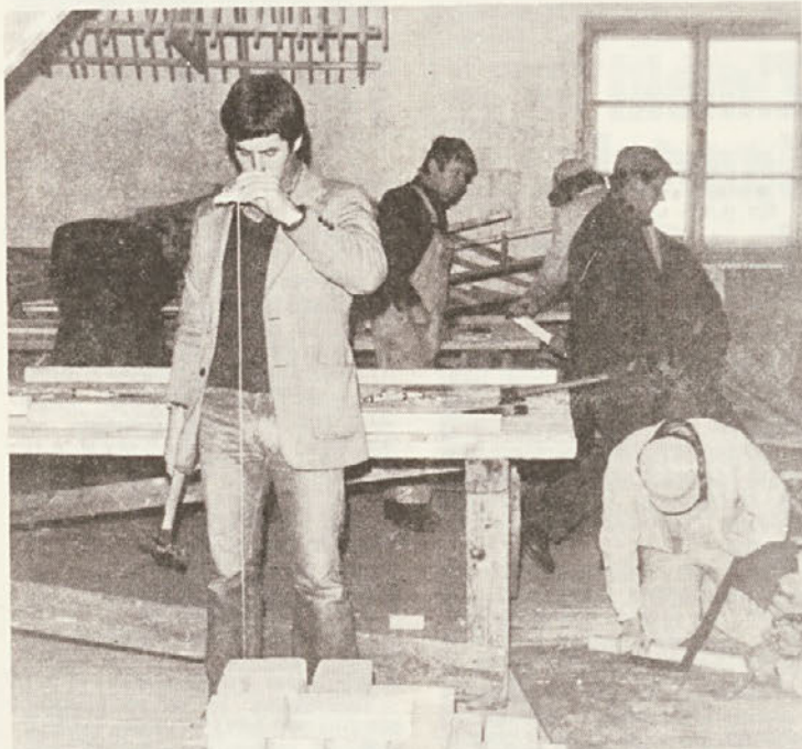
Udeleženci tečaja za pridobitev kvalifikacije ob delu v času praktičnega pouka Tečajnici za kvalifikacijo za vreme praktičnog rada u okviru seminara