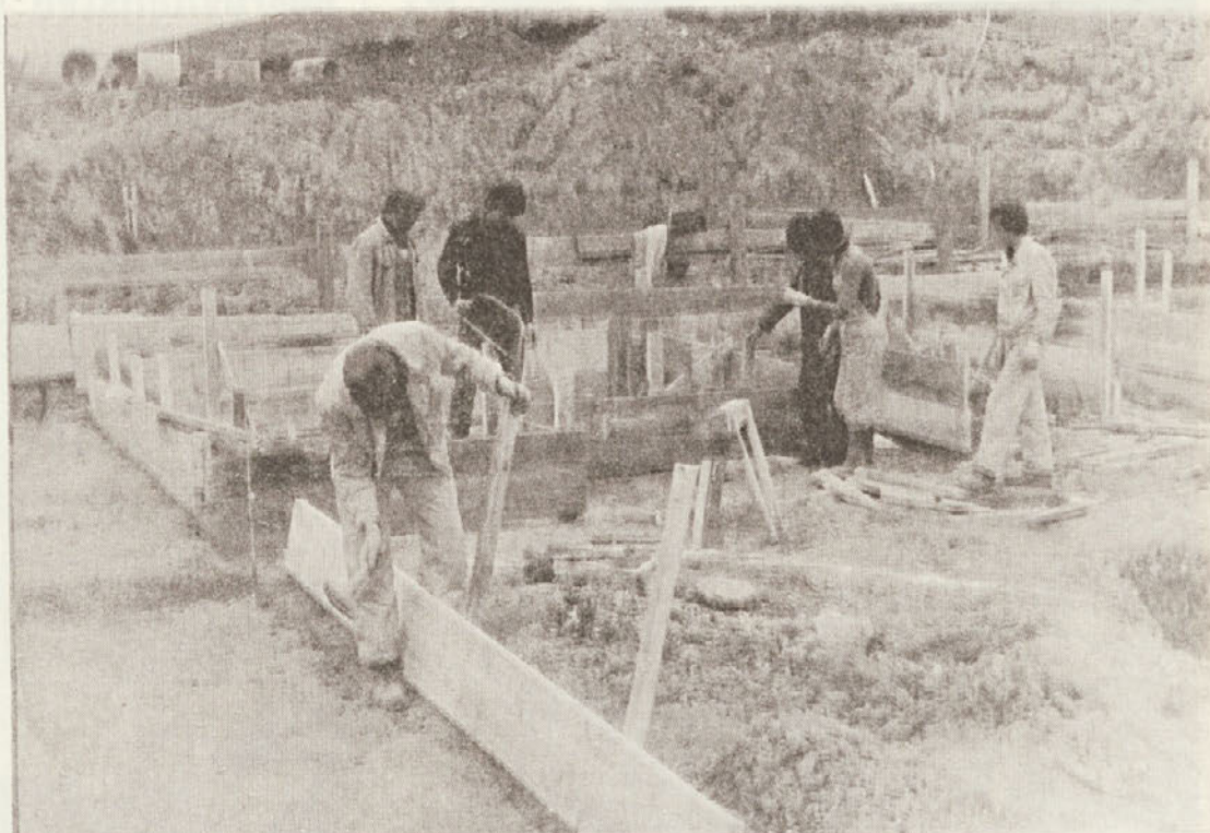
Dva bloka v Bršlinu v Novem mestu sta že pod streho, pri tretjem pa so začeli z betonerskimi deli v temeljih. Dva bloka u Bršlinu već su pod krovom a na trećem u teku su betonerski radovi na temeljima