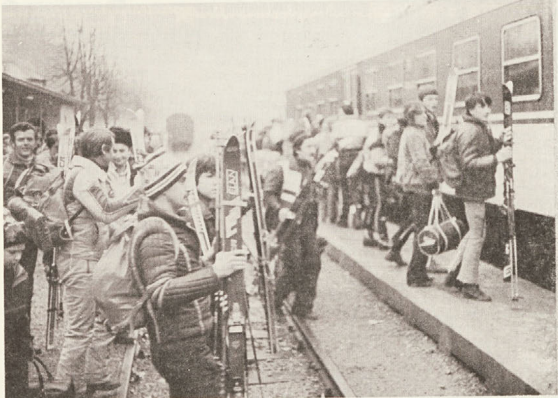
Beli vlak, ki je udeležence popeljal na tekmovanje Zimskega športnega dne na Gorenjsko je na postaji v Novem mestu nestrpno pričakovala prava množica tekmovalcev Bijeli vlak, koji je odveo takmičare na takmičenje u okviru Zimskog sportskog dana u Gorenjsku, na stanici u Novom mestu nestrpljivo je očekivalo pravo mnoštvo takmičara

U Sloveniji se je od 1. januara stasna mirovina zemljoradnika povećala na 1.280 dinara ili za skoro 52 procenta... Obzirom na protekle godine mirovina zemljoradnika će se ove godine povećati za više od tri puta (1976 godine iznosila je 410 din, 1977. godine — 515 din i 1978 godine — 595 din). 1981 godine mirovina zemljoradnika trebala bi iznositi bar 50 posto najmanjih mirovinskih primanja iz 1980 godine. Tako se ipak zemljoradničke mirovine približavaju željenoj visini tih mirovina, predviđenih za slijedeće srednjoročno razdoblje.