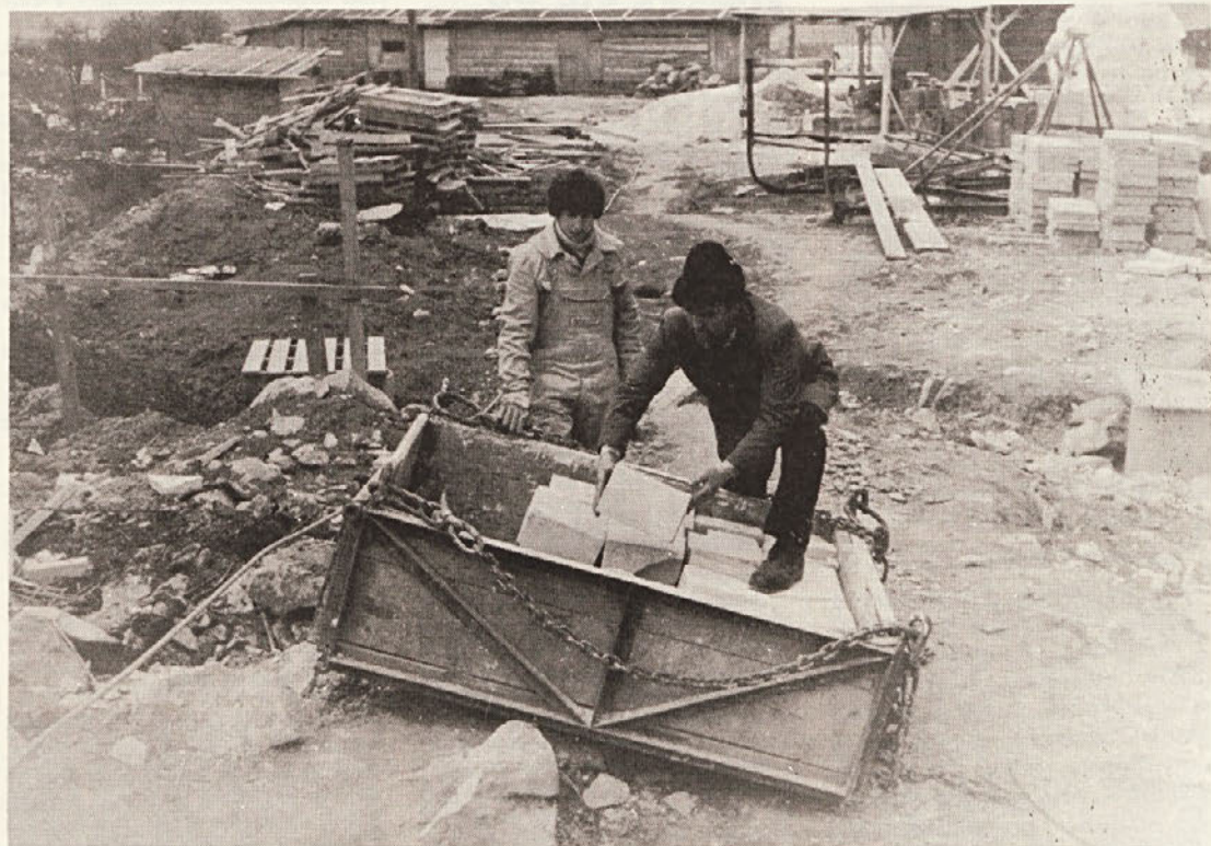
Vajenci s instruktorjem pri delu na stanovanjskih blokkih u Bršlinu v Novem mestu Učenci sa instruktorom delaju na stanbenom bloku u Bršlinu u Novom mestu