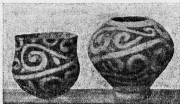
Poslikana keramika iz mlajše kamenenaste dobe.

Ko smo govorili spredaj v tem spisu o prastari kulturi, smo med drugim omenili, da je bilo takrat slikarstvo jako razvito ter da so ljudje kaj radi slikali na stene in poslikovali tudi svoja telesa in usnjasta oblačila. Tako se nam odkrije zveza s to praumetnostjo na poslikani keramični posodi, ki izvira že iz neolitika in sega od spodnjega Podonavja preko južne Rusije do Kitajske. Ukrasni motivi