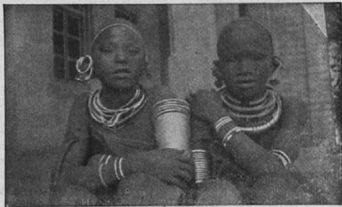
Paganski deklici z obročki, ki veljajo pri zamoreh kot najlepši okras.

služiti nebesa.« Umrla je po dolgotrajnih mukah, udana v voljo božjo, z veliko nežnostjo poljublja sve te petere rane Jezusove. Njen grob krasi vrtnica, podoba njenega trpljenja in ljubezni. Njena duša pa je pohitela v nebesa, kamor je tako hrepenela. Gotovo je zaslišala pred nebeškimi vrati besede božjega Odrešenika: »Pridi, blagoslovljena mojega Očeta in posedi kraljestvo, ki ti je bilo pripravljeno od začetka; kajti bolan sem bil in ti si me obiskala in mi stregla.«