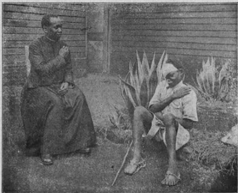
Duhovnik domačin uči ubovega gobovca križ.

Potrpežljivo jo prenaša v mavcu. V naslednji sobi se neki fant uči zopet hoditi. Imel je nogo zlomljeno nad kolenom. Njegovega tovariša je bila kača pičila. Iz prva se je bilo bati za njegovo življenje; zdaj mu gre na bolje. V naslednjih hišicah stanujejo ženske in otroci. Ženske imajo po večini vnetje pljuč, otroci oslovski kašelj ali ošpice. Nekateri imajo tudi hude rane, ki se tu uspešno