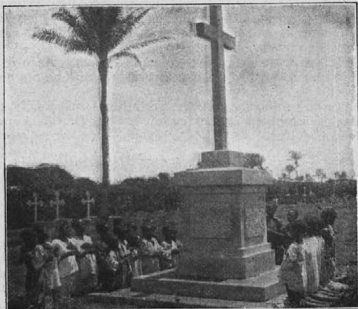
Križ na pokopališču. Zamorčki molijo za ljube dobrotnike.