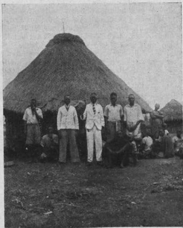
Moji pridni katehisti hodijo od vasi do vasi in pripravljajo pagane na sveti krst.