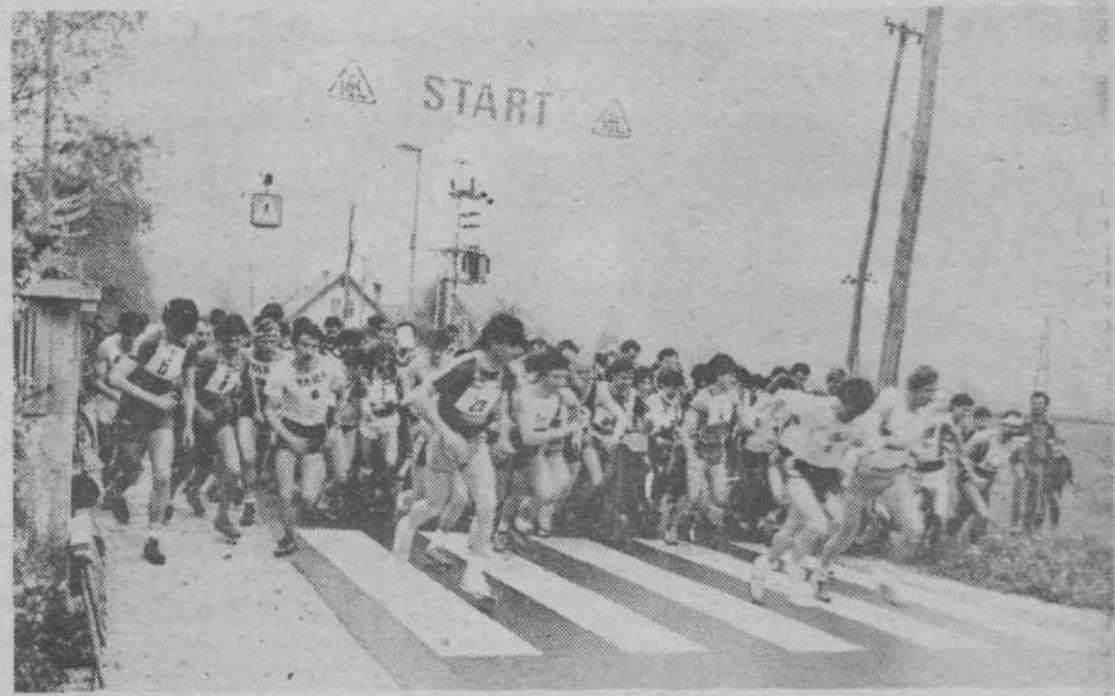
Start tekačev na zdržljivostni preizkušnji po poteh Molniške čete