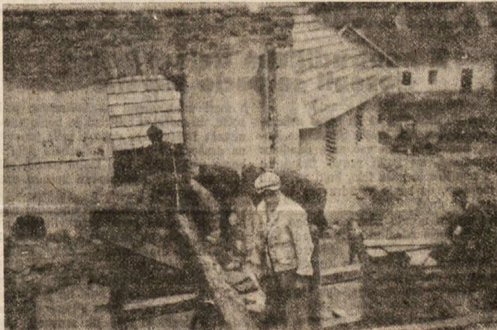
Tako smo gradili naš dom v Žitari vesi

Mladina Slovenske Koroške smo se kot del napredne jugoslovanske mladine že v času narodnoosvobodilne borbe borili v vrstah Jugoslovanske armade, ko je šlo za uničenje krvavega fašizma. Tako kakor takrat hodimo tudi danes skupno pot, pot v boljšo bodočnost, borimo se za trajen mir, za boljši življenjski položaj vsega delovnega ljudstva. Nikoli pa se ne bomo odrekli tistemu, za kar so dajali svoja življenja naši najboljši tovariši — partizani, to je priključitev Slovenske Koroške k matični državi FLR Jugoslaviji.