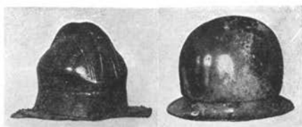
Čelade iz bronaste pločevine. Z Vač. (Ljubljana, Narodni muzej)

Kljub temu pa notranjost Zasavja v rimski dobi ni več dosegla onega razmaha kot v hallstattski. Rimljani so s svojim razvitim urbanističnim mišljenjem, ki so ga narekovali tudi vojaški oziri, odtegnili notranjosti žive vire in koncentrirali življenje v prej imenovanih mestih. Promet med njimi se je le deloma vršil po dolini, tako v glavnem le med Nevioudunom (preko Zidanega mosta) in Celeio. Nevioudun in Emona, Emona in Celeia pa so bili med seboj povezani z novimi velikimi cestami pokrajinskega tipa. Odročno ležeči kraji so dali v nemirnih časih poznega rimskega cesarstva zavetja marsikateri naselbini, ki je pribežala iz doline. Primer takega pri-