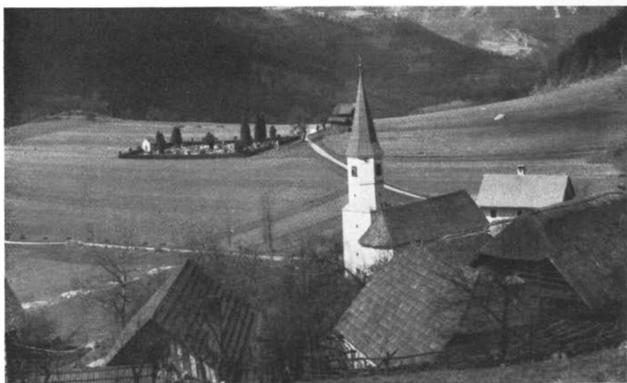
Vas Širje pod Kopitnikom

redka in zato zaščiten. Vendar spada med one maloštevilne zavarovane rastline, ki jih strastni uničevalci imenitnih cvetlic puščajo v miru: pač zato, ker niti z vonjem niti s posebno lepoto ne draži njihovega poželenja.