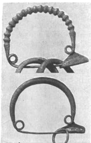
Fibule (zaponke) iz bronca. Z Vač. (Ljubljana, Narodni muzej)

To je okvir, skozi katerega moramo gledati na naše Zasavje v najstarejših dobah starega veka, v neolitiku: Zasavje je prehod za številne silnice in gibanja. Je najtesneje povezano s prvo poselitvijo