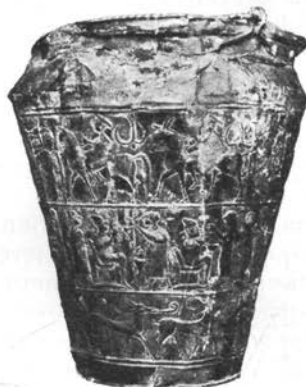
Situla iz bronaste pločevine. Z Vač. (Ljubljana, Narodni muzej)

Tako omejeno Zasavje je izrazito komunikacijsko ozemlje, ki veže skoraj vse strani neba; združevalna komunikacija je Sava, ki pri Zidanem mostu sprejema silnice s severa in jugovzhoda in jih tjakaj oddaja, nato pa jih vodi proti zahodu v Ljubljansko kotlino in dalje