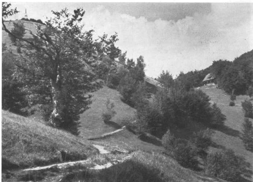
Motiv z Mrzlice