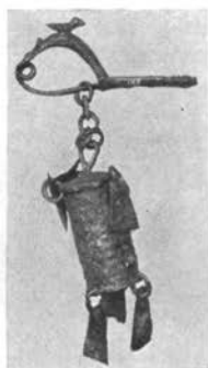
Fibula (zaponka) iz bronu. Na zaponki ptičja figura, obesek v obliki valjaste puščice. Z Vač. (Ljubljana, Narodni muzej)

Stični 9 itd.) samostojen center kulture, še več: središče samostojne kulture, ki je vtisnila pečat vsej kulturni ostalini iz tedanje dobe našega slovenskega ozemlja. To dobo imenujemo tudi hallstattsko dobo. Vendar blagostanje ni trajalo dolgo, kajti zakladi rude so se manjšali in s tem pogoji gospodarskega procvita. Že sledeča laténska doba (nosilci kulture so bili Kelti) ni v Zasavju pustila nobenih vidnejših sledov, z izjemo prav skromnih v Trbovljah (keltski novci), Rojah pri Moravčah (grobovi) in v Zagorju. Od rudarstva je zasavski človek polagoma pač prešel k poljedelstvu in živinoreji, kolikor je bilo to možno. Še bolj se je umaknilo življenje iz Zasavja v rimski dobi, ko so Rimljani to »prometno oviro« premagali s tem, da so speljali vzporedno s Savsko dolino veliko vojaško cesto iz Ljubljane čez Domžale in Trojane v Celje, s čimer je zasavska soteska postala brezpomembna. Težišče se je zopet premaknilo v mesta, tako v Ljubljano — Emono na eni, v Celje — Celeio na drugi in