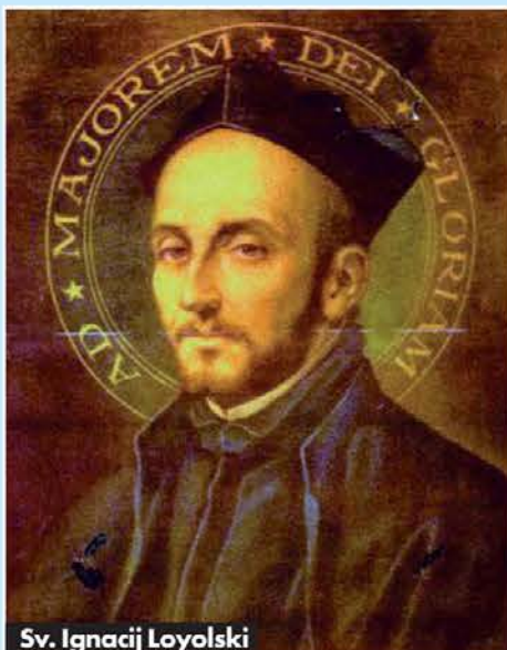
Sv. Ignacij Loyolski