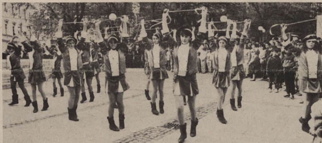
Nastop mažuretk na prireditvi ob dnevu OF

Pri tem nočemo, da bi prihajalo do spopada generacij, ker se sedaj dogaja, ko je vse, kar je mladega, slabo in neumno ter