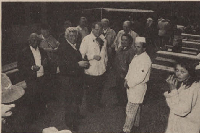
Prijateljski nasmeh ob predstavitvi kuhinje iz Oer-Erkenschwicka

Kočevci so nato ob koncu aprila obisk vrtili. V Oer-Er-