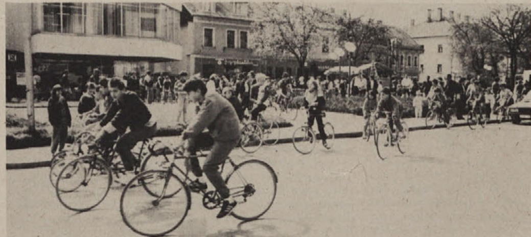
Kolesarski trimček do Starega loga in nazaj v počastitev dneva OF

Zato hočemo, da se vodilni v občini, republiki in državi nehajo pričakati o njihovem pre-