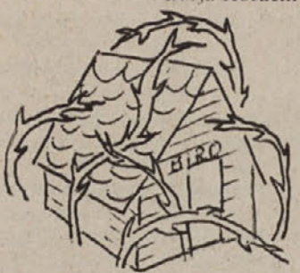
»Prebujanje kočevskega turizma«