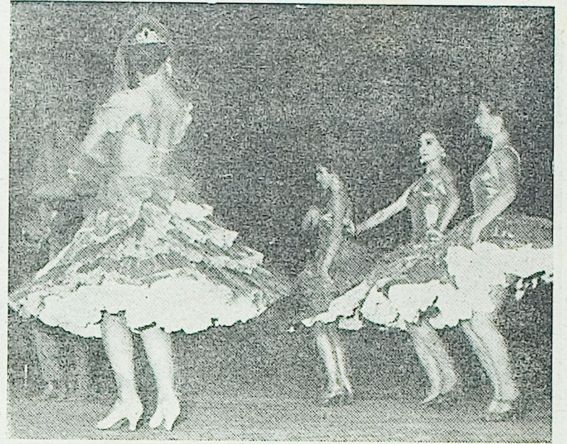
Letošnja sezona je bila na Koprskem tudi v kulturno zabavnem pogledu izredno bogata in so Primorske prireditve na tem področju z uspehom odigrale svojo pomembno vlogo. Zavod se pogaja še za nekatere nastope, te dni pa so bile zaključene kar tri lepe prireditve. O tem preberite več v posebnem poročilu, na sliki zgoraj pa si ogledajte detajle z nastopa Adriatica-show v Portorožu minuli teden. Prireditve so navdušile številne domače in tuje goste in požele nedeljiva priznanja hvaležne publike