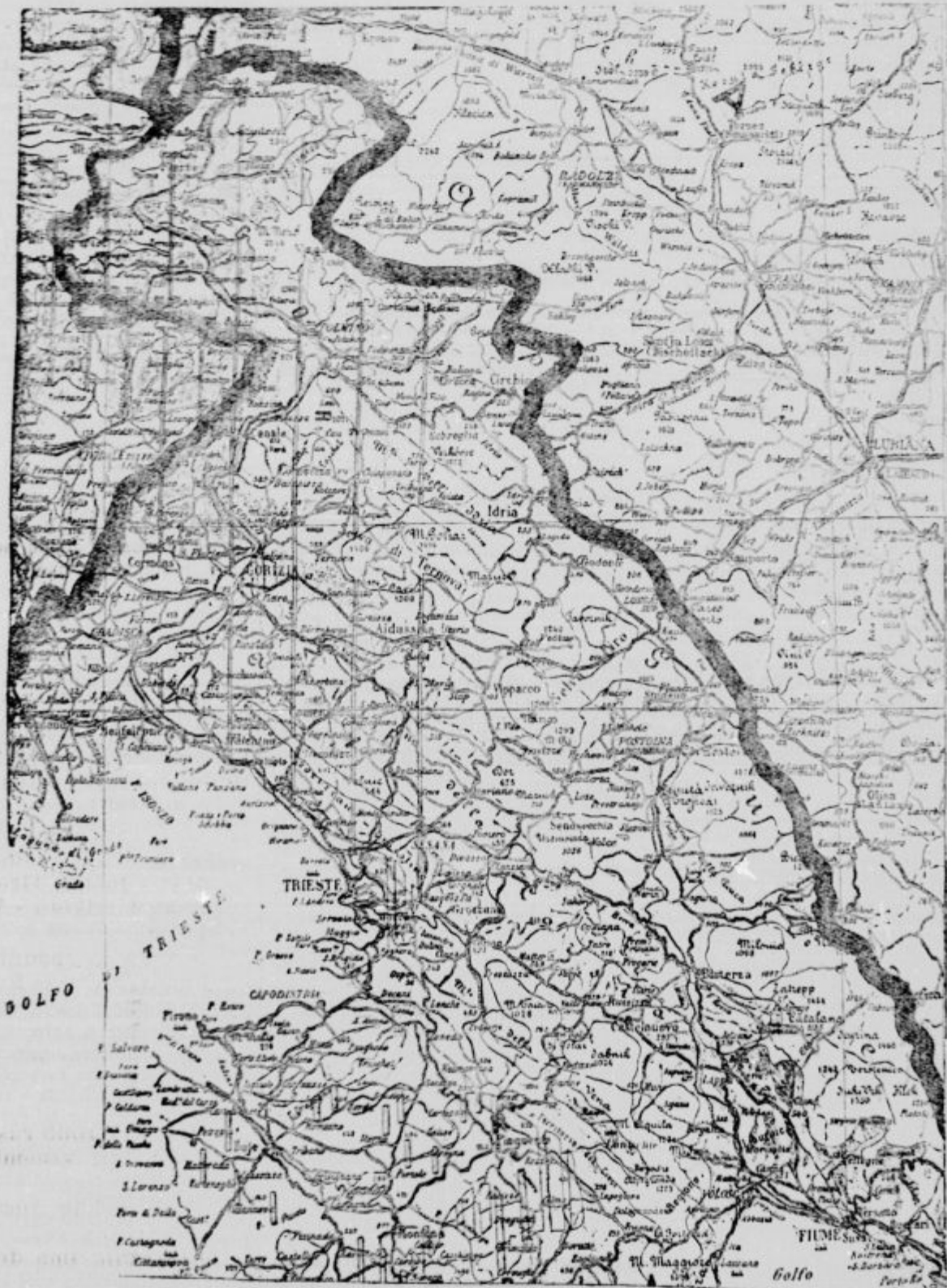
Zemljevid, ki kaže italijanske želje.

Naprej po poti višje stanovske in gospodinjiske izobrazbe, kjerkoli se vam nudi. Kar je pametnega, uporabnega, dobrega, si osvojite! Osrečite svoje vašega domovja! Naj poslana kmečki stan, ki je steber državi in njen up, res vsem v ponos! X.