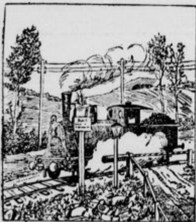
Kje sta strojevodja in kurjač?