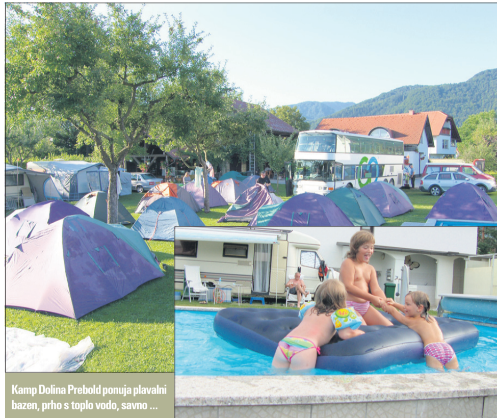
Kamp Dolina Prebold ponuja plavalni bazen, prho s toplo vodo, savno ...