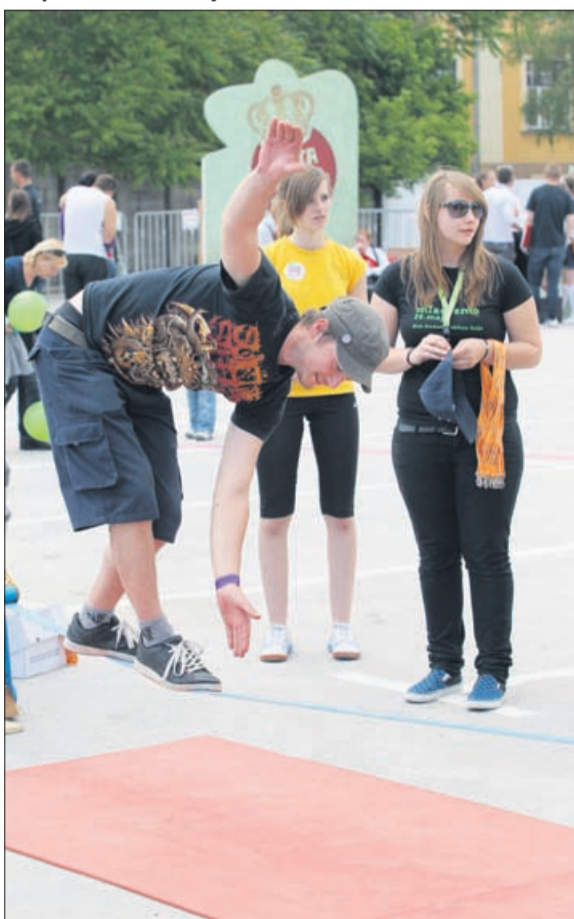
Ravnotežje so popoldne obiskovalci lovili še dokaj dobro, v jutranjih urah nekoliko slabše.