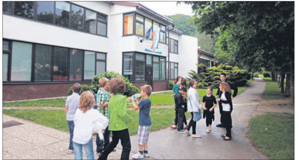
Moderno osnovno šolo so v Kostrivnici dobili leta 1980, leta 2002 pa so k njej dogradili še telovadnico in dodatni razred.