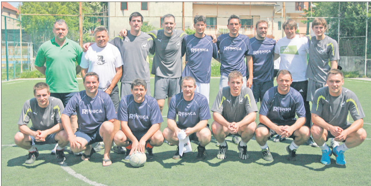
Zvezdniški Čukarički je imel po vzoru rokometnega kluba na prsih napisano Resnica boli, na hrbtih pa Čukarički je zakon. Rokometarji se tokrat niso »postavljali« z domiselnimi napisi.