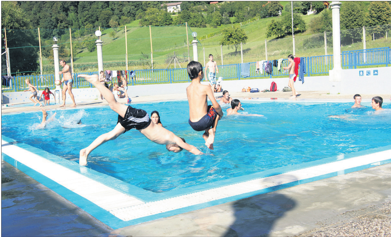
Tako je bilo na letnem kopališču na Frankolovem zadnje kopalno sezono. Z upravljanjem mladinskega društva so vsi zadovoljni.