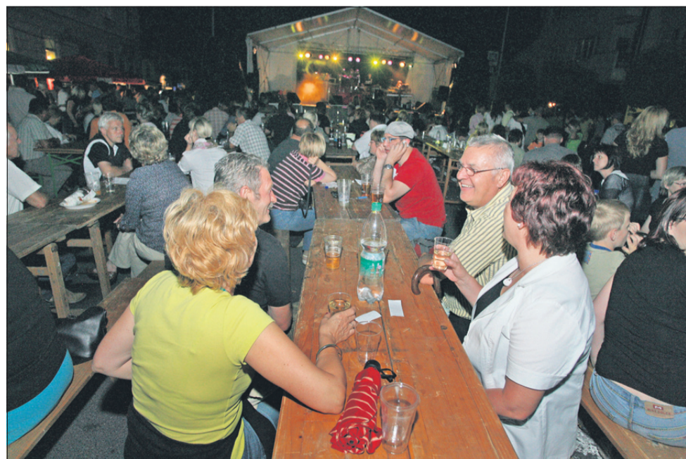
Žalska noč, ki so jo lani znova obudili, bo letos 16. junija.

Več fotografij tudi na www.radiocelje.com in facebook-u Novi tednik in Radio Celje.