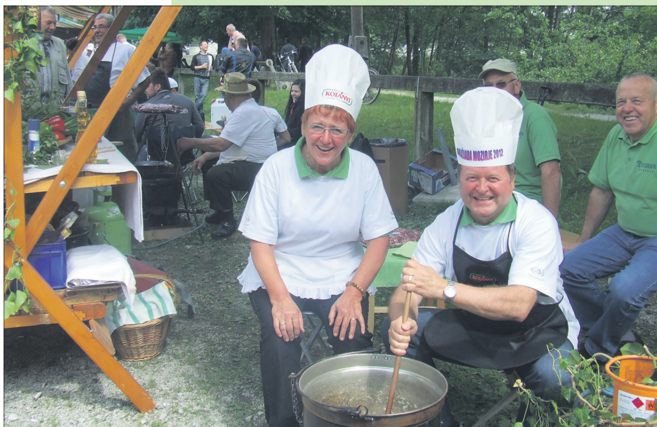
Eko ali ne, dišalo je kot pri pravem golažu.

MEDIJSKI POKROVITELJ NOVI TEDNIK IN RADIO CELJE