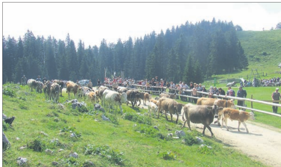
Pašna skupnost Menina-Gospodnja-Globača vsako leto na Menini pripravi praznik pastirjev.

Slovenskim agrarnim skupnostim sorodne oblike so poznane po celem svetu, v sosednjih državah, ki so se ravno tako soočale s podobnimi težavami kot se danes AS v Sloveniji so uspeli povleči nekatere poteze, ki danes tamkajšnjim AS omogočajo učinkovitejše delovanje.