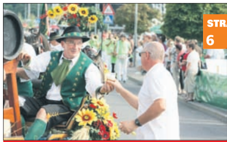
Išče se organizator Piva in cvetja