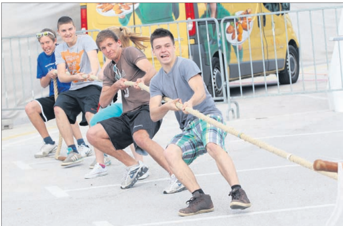
Čeprav so mladi s Celjskega na dogodku Mladi smo stopili skupaj in združili moči, so se na popoldanskem delu prireditve tudi pomerili med seboj.