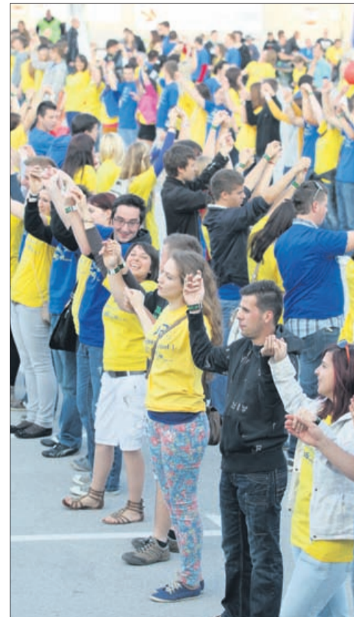
Maturantje so na četvorki dvignili roke v zrak, najverjetneje pa v teh dneh komaj čakajo, da bodo lahko roke čim prej dvignili nad srednjo šolo.