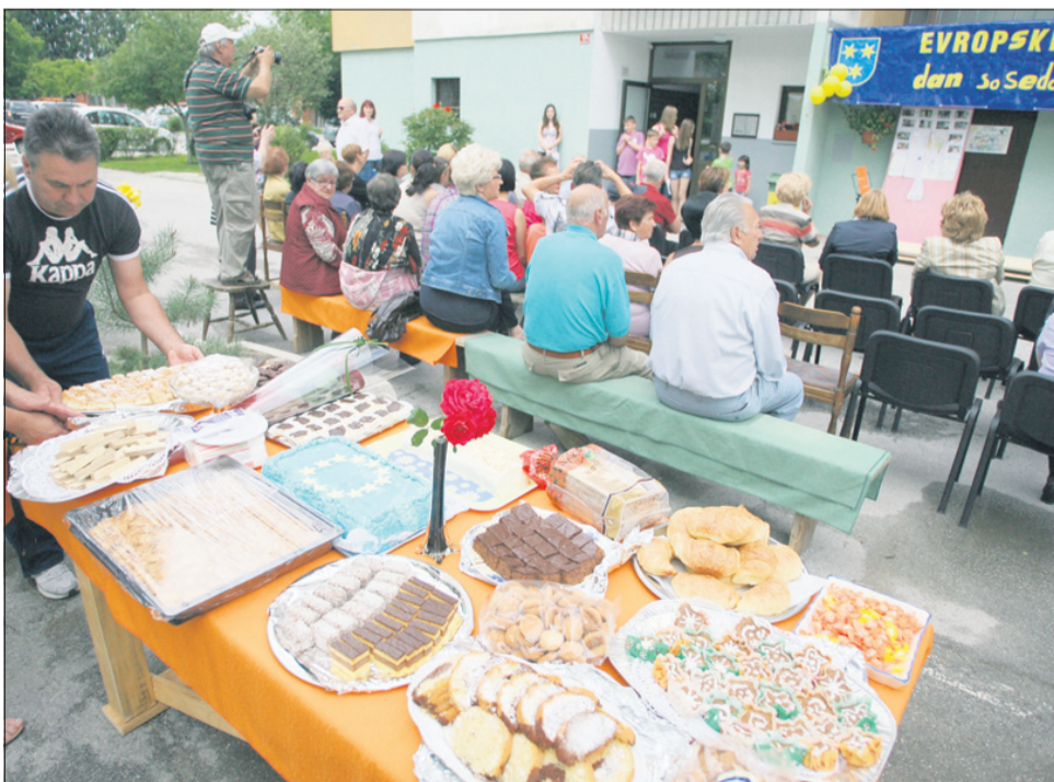
Parkirišče pred blokom na Hudinji je postalo prireditveni prostor.