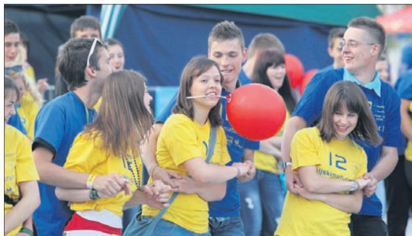
Čeprav Slovenci z letošnjo maturantsko parado nismo podrli rekorda, to prav nič ni vplivalo na vzdušje med dijaki.