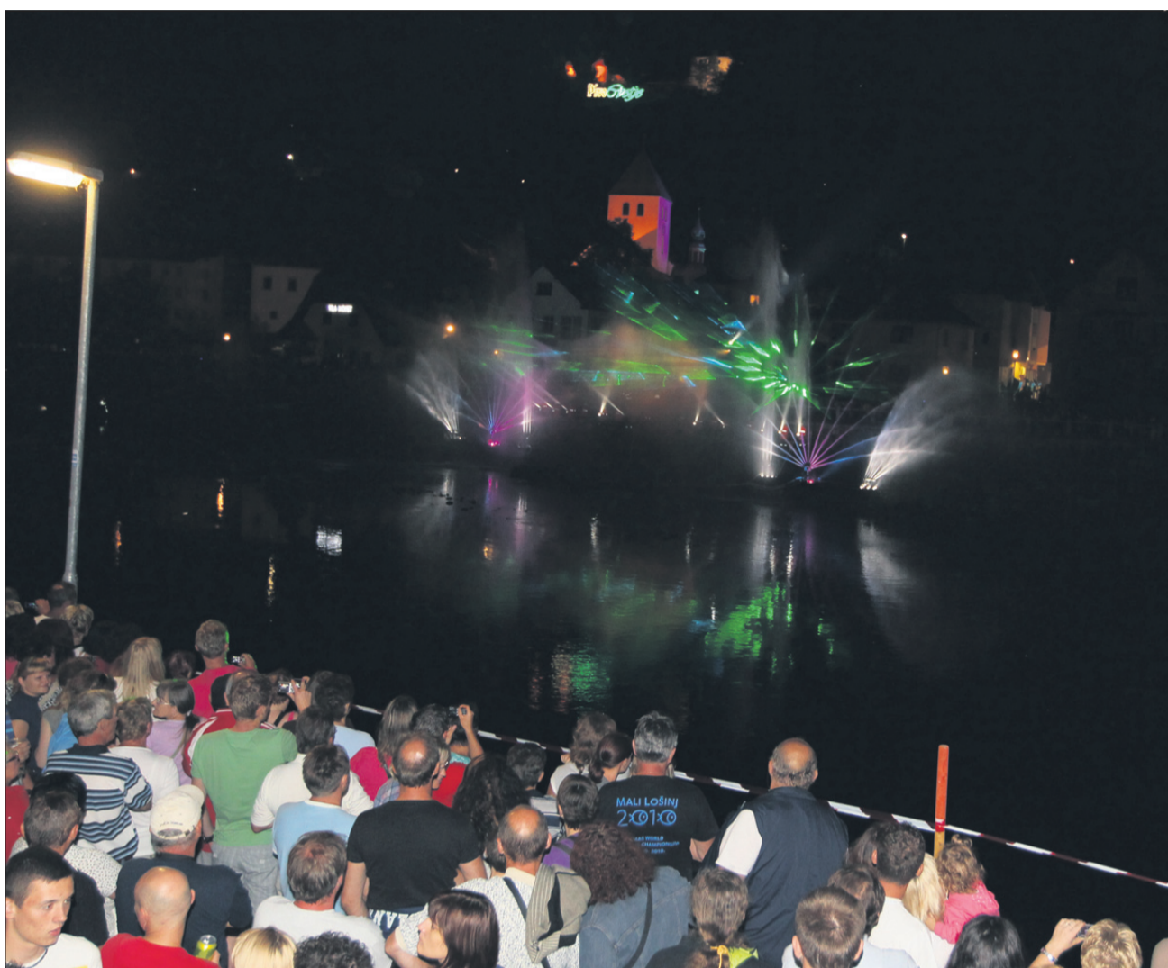
Lani je bilo na prireditvi Pivo in cvetje 120 tisoč obiskovalcev.