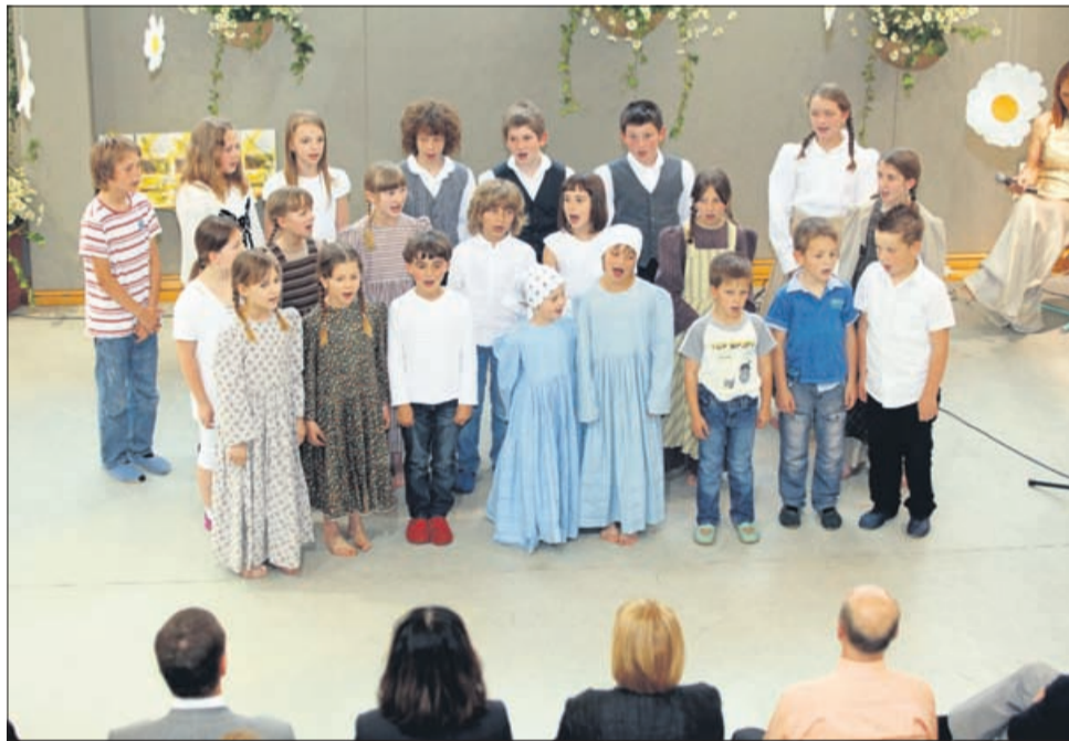
Kostrivniški učenci poleg pouka počno še marsikaj. Plešejo, planinarijo, ustvarjajo likovne izdelke in gledališke igre, radi imajo šport, seveda pa ne gre niti brez petja.