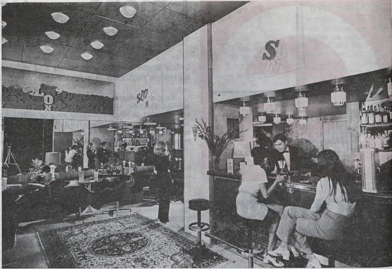
TOZD hotel Slon — pogled na aperitiv bar pravkar povečanega hotela v Ljubljani