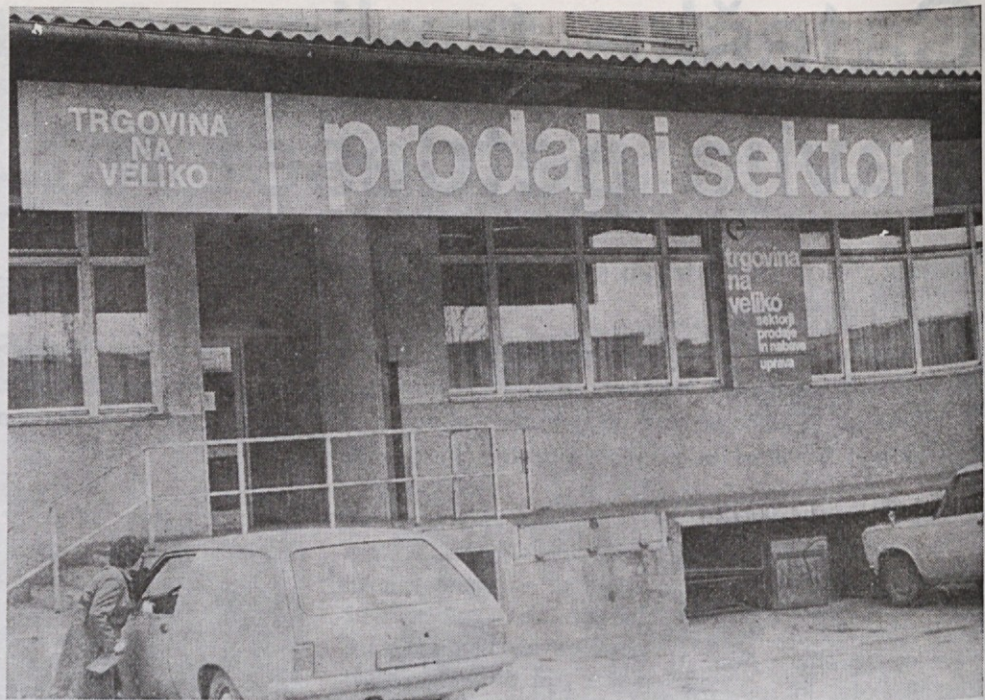
TOZD trgovina na veliko na Šmartinski cesti, prodajni sektor, ki se je preselil »čez cesto«