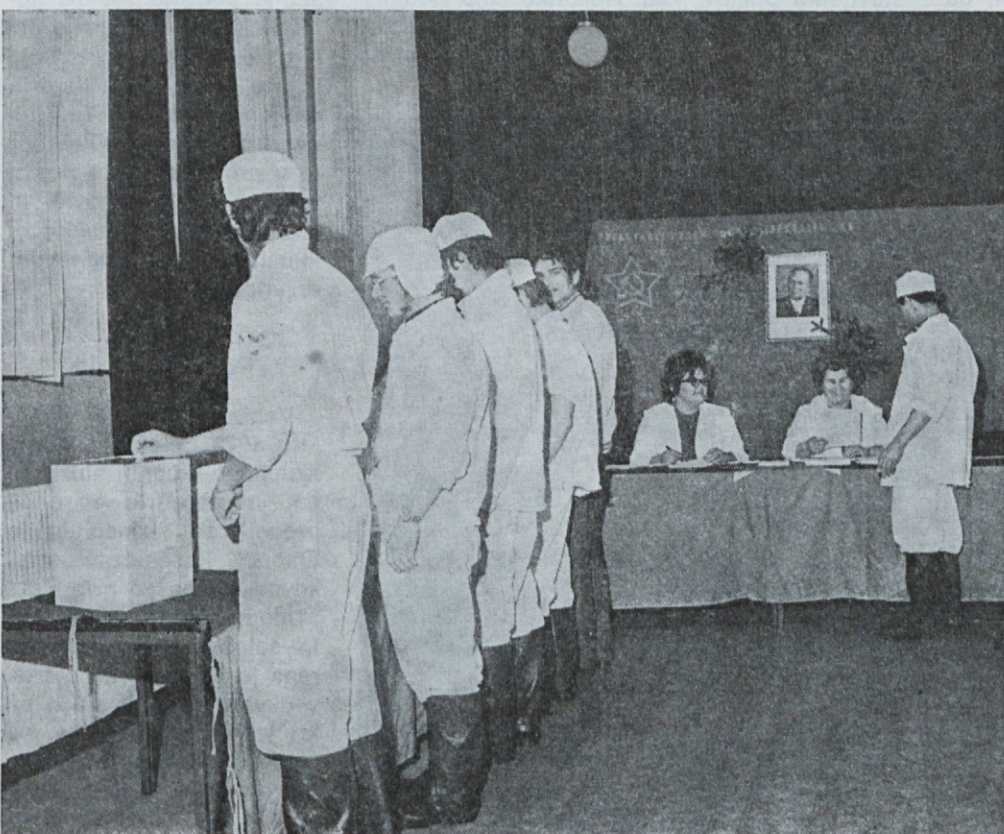
Volitve delegatov v TOZD Mesna industrija Zalog

Temeljne organizacije združenega dela, katerih finančni rezultat to omogoča, naj bi svojo amortizacijo povečale za toliko, da bodo z njo lahko krijele svoje obveznosti.