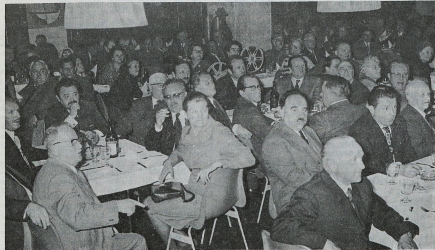
Na prijateljskem srečanju naših upokojencev, ki se ga je udeležilo okrog 300 zvestih Emoncev

Upokojenci in upokojenke drage, končane naše so življenjske snage. Za dovršeno naše delo pa nam priznanje je uspelo. Ko sem dopolnil leta svoja in s tem pravico do pokoja, sem razpravljaj sam s seboj: Je res konec zdaj z menoj? Telo, spomin, razsodnost peša in se z betežnostjo pomeša, misliš na mladostne dni in kaj vse se z leti spremeni. Danes prilika je dana, da smo družba skupaj zbrana, da vesel večer bi preživeli, spomine stare obudili, kako smo z delom se bodrili. Zdaj pa nam ureditev omogoča zaposlitev in na starost treba ni skrbeti, da ne mogli bi živeti. Na zdravje torej vsem s kozarcem vina in mera dobre volje naj bo obilna!