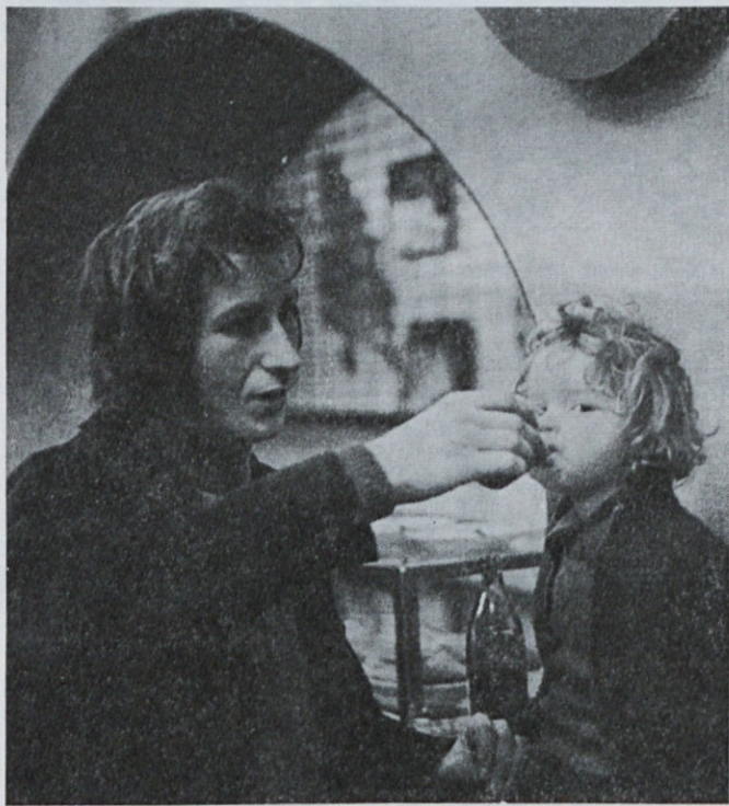
V Supermarketu: Dekletce je premagala nepotolažljiva žej

Smelo moramo pristopiti k uresničevanju letošnjih načrtov in obveznosti. Nekoliko smo zanemarili osnovno reprodukcijo. Naše podjetje je dolžno