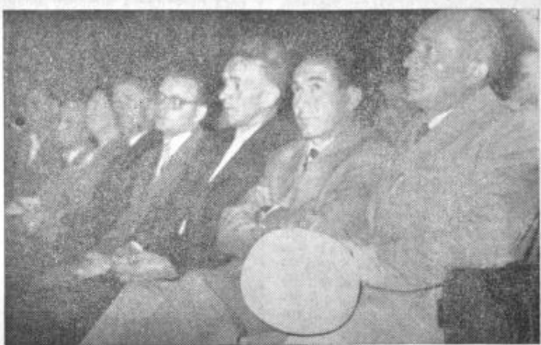
Gostje med zborovanjem prosvetnih delavcev

Na zborovanju so podrobno analizirali izkušnje in uspehe, ki so jih dosegla večja industrijska podjetja v konjiški občini z uvedbo nagrajevanja po dejansko vložnem delu. Tako so v Lesno industrijskem podjetju kljub temu, da je zaradi okvare stal najpomembnejši stroj, zvišali storilnost do 15 odstotkov. V nekaterih ekonomskih enotah so zabeležili večje uspehe, druge manjše. Iz vzrokov tega nesorazmerja, ki jih bodo proučili, bodo poizkusili popraviti še nekatere slabosti njihovega sedanega sistema nagrajevanja. V Konusu so z novim sistemom nagrajevanja naredili velik korak naprej. Proučili so vrsto oblik in izbrali za njih najustreznejšo. Tako je pri njih merilo za nagrajevanje vsakega zaposlenega delavca njegov