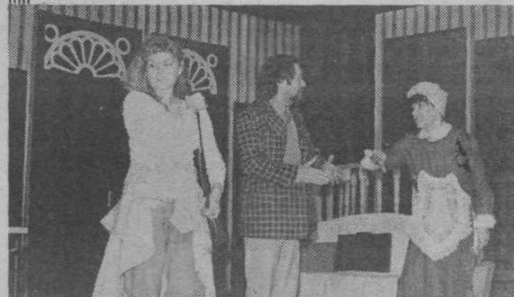
Na sliki je prizor iz komedije HRUP ZA ODRUM, ki jo bo 21. februarja uprizorilo Primorsko dramsko gledališče iz Nove Gorice

V mesecu februarju bo zveza kulturnih organizacij Lj. Moste-Polje pripravila še dva posveta, oba v prostorih kulturnega doma Španski borci, in sicer v ponedeljek, 18. februarja ob 13. uri posvet s predsedniki kulturno-umetniških društev in skupin ter ob 18. uri posvet z mentorji plesnih skupin.