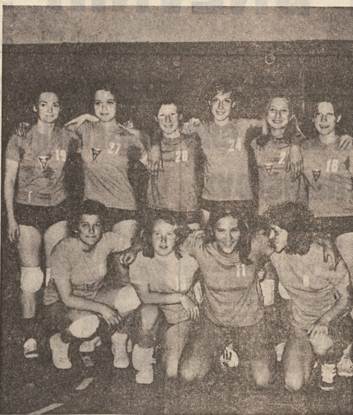
Mlada ženska odbojkarica šesterka tržaškega Bora (na sliki) se bo v prvenstvu 1. divizije pomerila v slovenskem derbiju s Slogo

Spored: 31. maja, ob 18.00 in ob 19.30 kvalifikacijski tekmi; 2. junija, ob 18.00 finale za 3. in 4. mesto, ob 19.30 finale za 1. in 2. mesto.