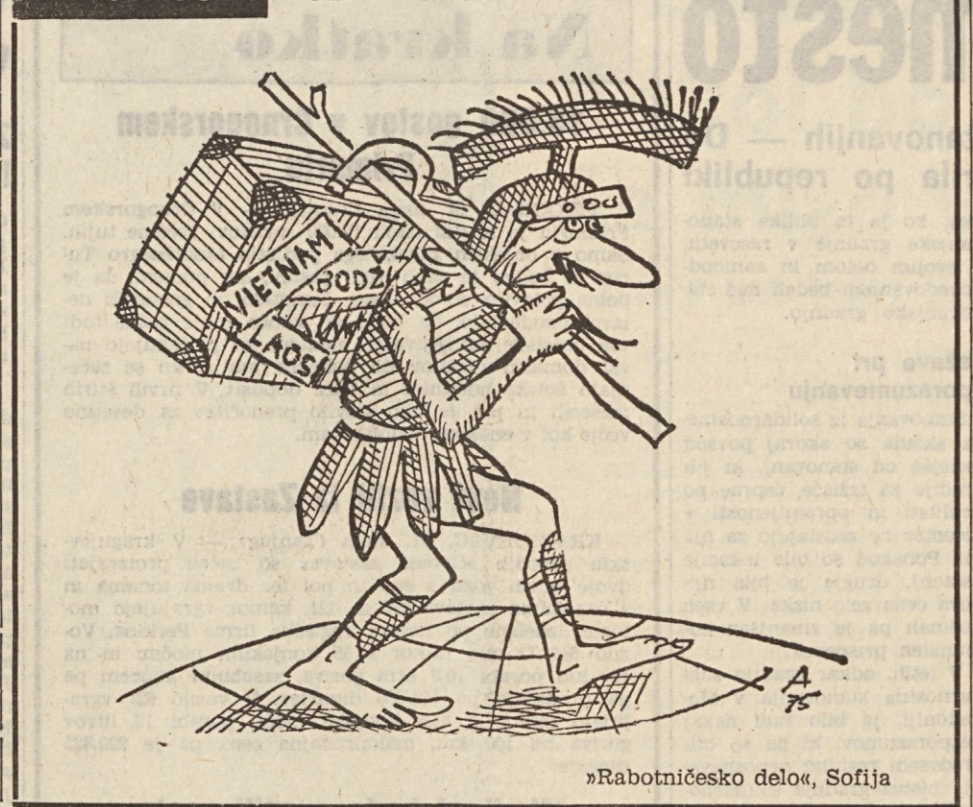
»Rabotniško delo«, Sofija