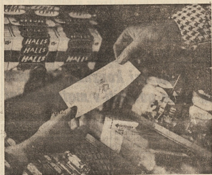
Listki olimpijske loterije

Te dni so bile igre spet v nevarnosti - Toda ne iz finančnih razlogov - Vsi načrti so bili še premalo optimistični - Tudi drugi efekt županovih zamisli