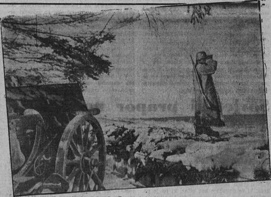
Na obrežni straži v snegu in ledu

Na različnih odsekih ostale vzhodne fronte, kjer traja južno vreme, smo tudi odbili sovražne napade deloma po trdih