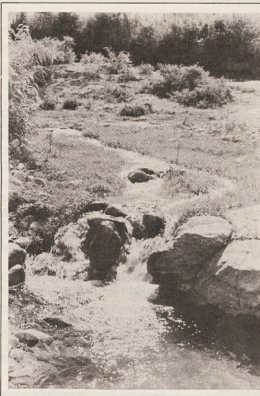
Dolores, Córdoba

ljivim obredom pepeljenja začne postni čas. Obred spremljajo naslednje besede: „Spreobrnite se in verujte evangeliju“ ali „Pomni, človek, da si prah in da se v prah povrneš!“ Kdor bo tem resnim besedam prisluhnil površno, bo v tem obredu videl nekaj pogrebnega, nesodobnega. Toda v resnici ni tako.