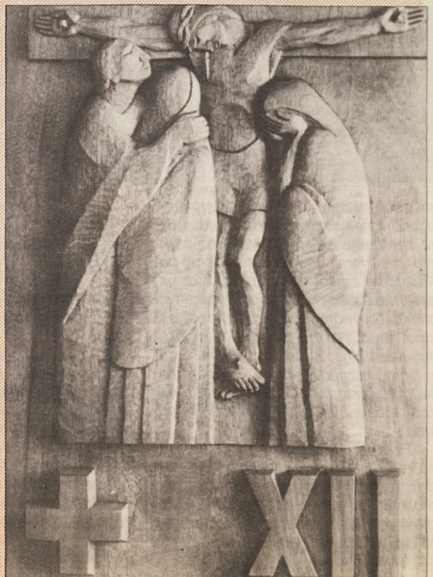
IVAN BUKOVEC: KRIŽEV POT V CERKVI MARIJE KRALJICE V SLOVENSKI VASI