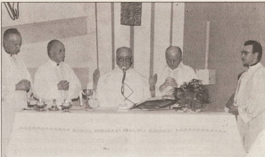
Sobota, 1. februarja 1922 v Slovenski hiši. Zahvalna sv. maša ob priznanju Republike Slovenije. Spodaj: narodne noše na slovesnosti.