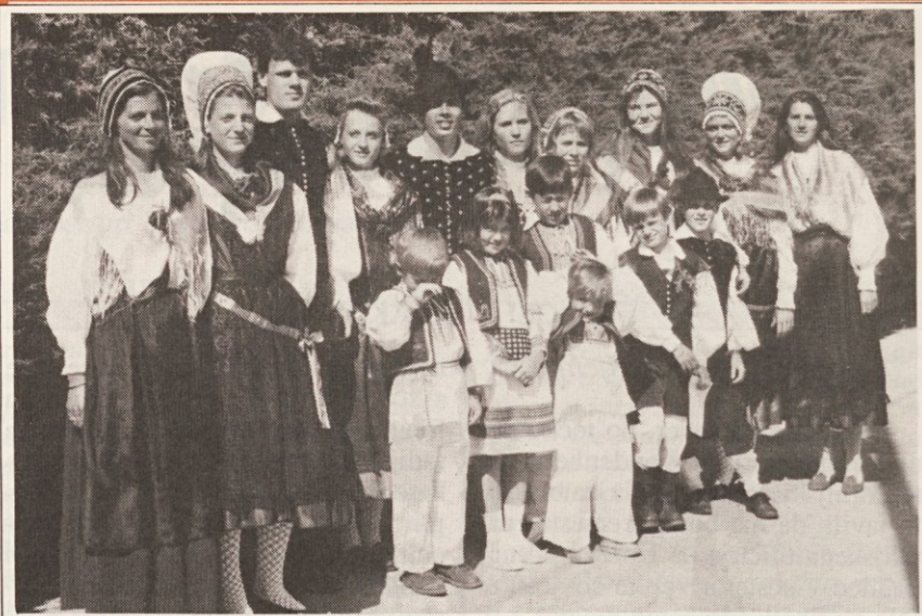
Skupina slovenskih narodnih noš, med katerimi so štirje hrvaški otroci v narodnih nošah, po zahvalni sv. maši v Bariločah.

To je priložnost! Če bomo tako blizu kanadske obale, kar nam sicer nikoli ne bi bilo dano, potem bi mi bilo mogoče uspelo. Načrtoval sem, da skočim v vodo, ko bo naša ladja zunaj teritorialnih voda, torej dvanajst milj od obale, in da bom uporabil kakšen les za plovilo. Vedel pa sem, kakšno temperaturo ima voda, in zavedal sem se, da bi prej umrl, kot pa preplaval tiste milje. Sedaj pa gremo v kanadske vode! Ta misel mi je dala novo upanje in moč. Karkoli se zgodi, odločil sem se: čez pet dni se ne bom vrnil v Rusijo na krovu Uljanove. V tisto življenje tam se ne vrnem več.