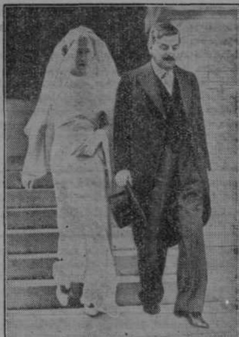
Francoski ministrski predsednik Laval pelje svojo hčerko po poroki iz cerkve.