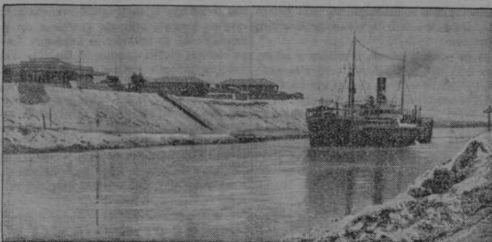
Sueški prekop, katerega bodo najbrž Angleži zaprli za italijanske ladje v slučaju vojne med Italijo in Abesinijo.