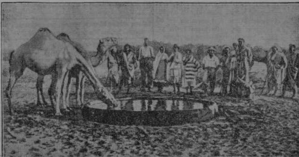
Ob studencu v Abesiniji.