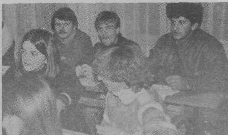
Z volilno programske konference OK ZSMS Grosuplje