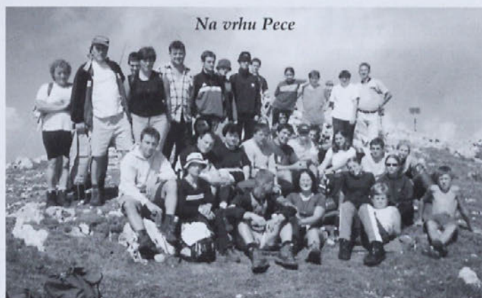
Na vrhu Pece