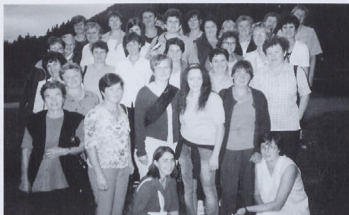
Prijeten zaključek izleta ob Ivarčkem jezeru

delavo puranjega mesa. Videle smo purančke, ki so se valili, pa purane, godne za zakol, in nato še predelavo puranjega mesa. Brez degustacije seveda ne gre. Obilna malica nam je zares teknila in dobre volje smo se odpravile dalje.