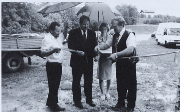
Slovesen prerez traku ob močnem nalivu