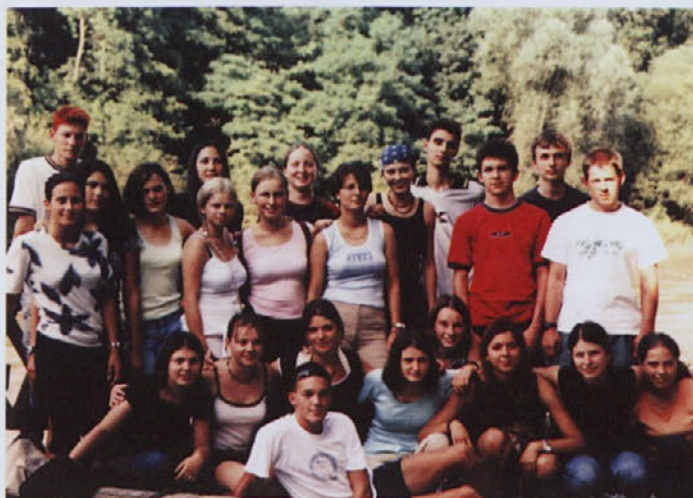
Zoisovi stipendisti na taboru „Žetale 2002“