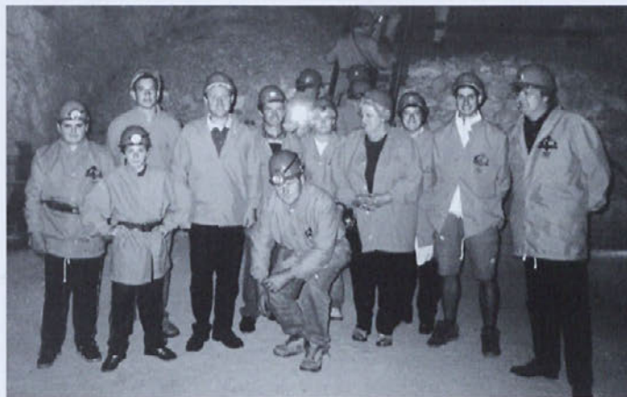
Globoko v podzemlju Pece