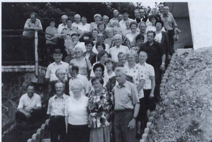
Srečanje starostnikov leta 1998

Nekateri so odšli v tujino, drugi smo ostali doma in se posvetili haloški zemlji ter si v lastnem znoju prislužili skromno pokojnino. Spominov na prehojeno pot je veliko, marsikaj nam je bilo težko, bili so pa tudi lepi trenutki, ki so nam dajali pogum, moč in upanje za nadaljnje življenje.