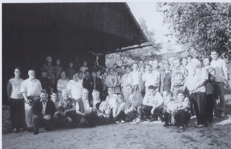
Pred Prežihovo bajto v Kotljah

skupini in nas opozorili, da moramo strogo upoštevati njihova navodila. V nasprotnem primeru se lahko kdo izgubi in iskanje je v 800 km labirintu rogov skoraj nemogoče. Iz povedanega in prikazanega smo lahko spoznali, da je bilo delo v rudniku svinca v Mežici zelo naporno. Človeka kar nekako stisne pri srcu, ko izve podatek, da so v rudniku poleg družinskih članov delali tudi 9 letni otroci.