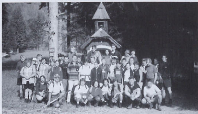
Pred nami je naporna pot

Letošnji drugi planinski izlet Planinskega društva (PD) Žetale je bil v znamenju kraljestva pravljničnega Kralja Matjaža in letošnjega poletja. Več kot štirideset planinskih navdušencev je v spremstvu vodnikov izkoristilo s soncem obsijano zadnjo avgustovsko soboto za pohod na Peco.