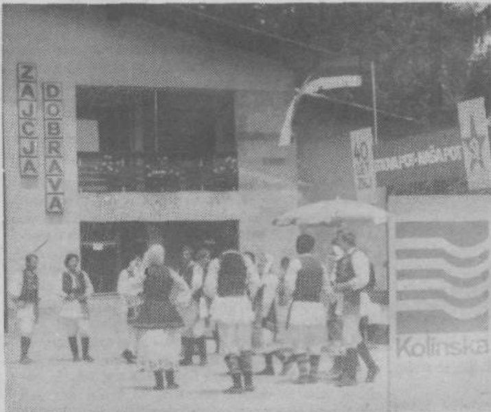
Delovna organizacija Kolinska je 25. junija praznovala DAN KOLINSKE. Slovesnost, ki se je začela s kulturnim programom ter nadaljevala z govorom in podelitvijo priznanj delavcem za njih delo, je bila ob gostišču v Zajčji dobri. Izvenela je v sproščenem tovariškem srečanju v prelepem vremenu. Ta dan je bil resnično DAN KOLINSKE