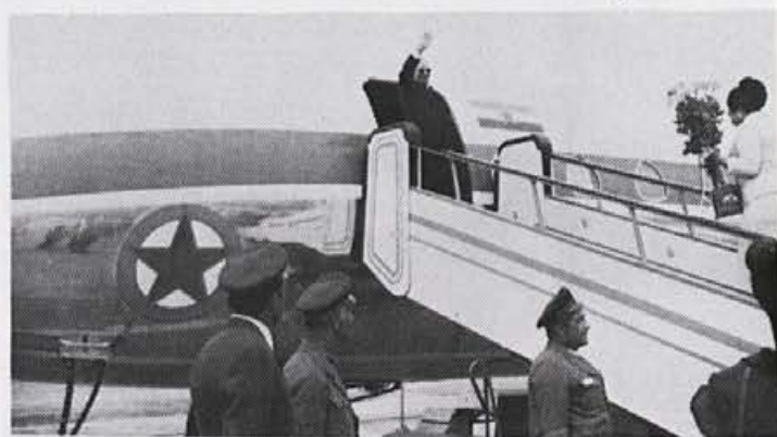
Tito ambasador miru v svetu