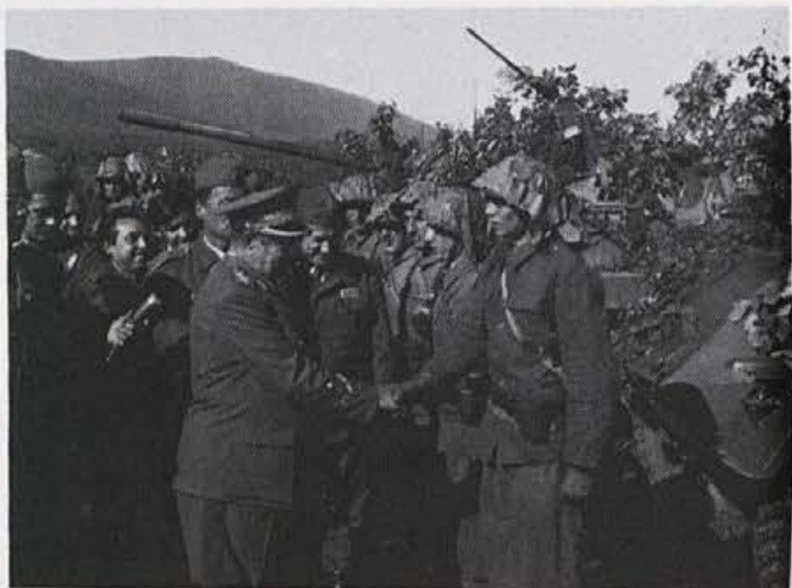
Vrhovni komandant jugoslovanske ljudske armade