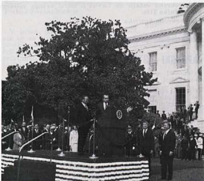
V Združenih državah Amerike