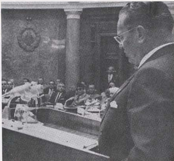
Na 1. konferenci neuvrščenih držav v Beogradu 1961