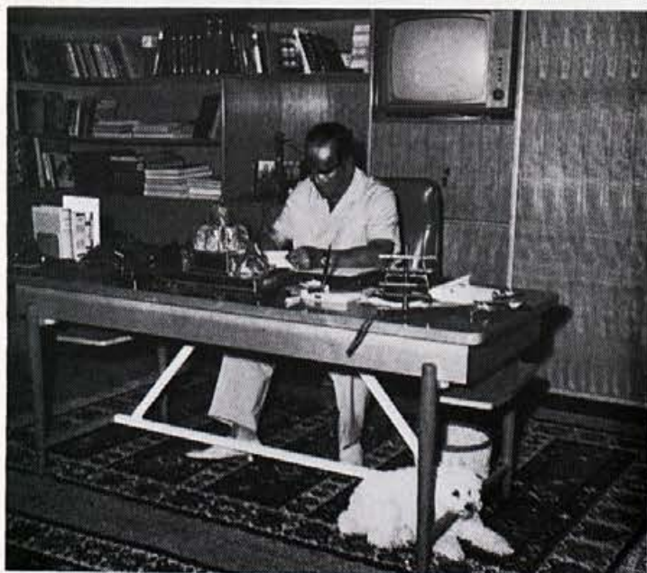
Na svojem delovnem mestu