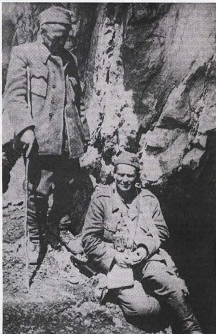
Iz NOB – Tito ranjen