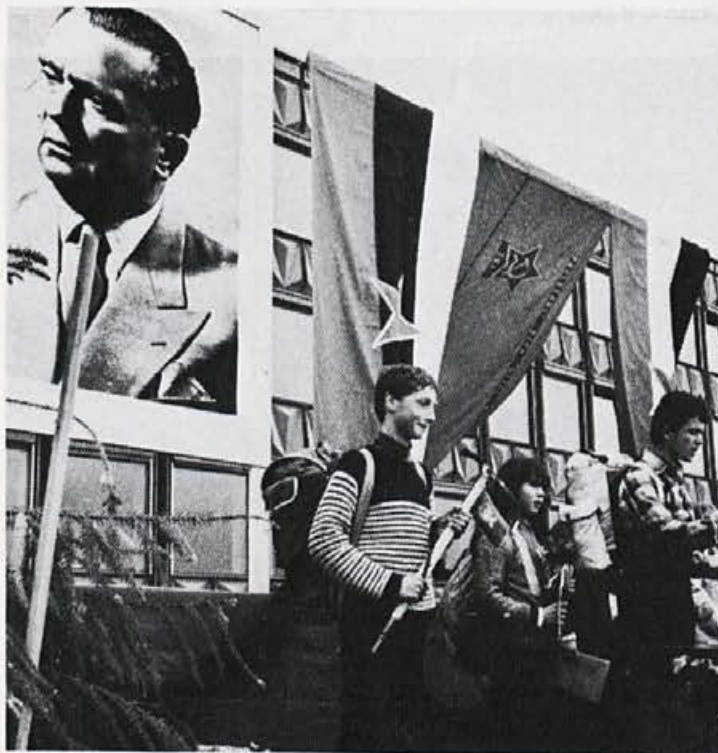
Predaja Planinske štafete