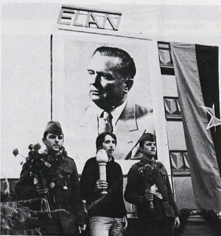
Predaja Jeloviške štafete