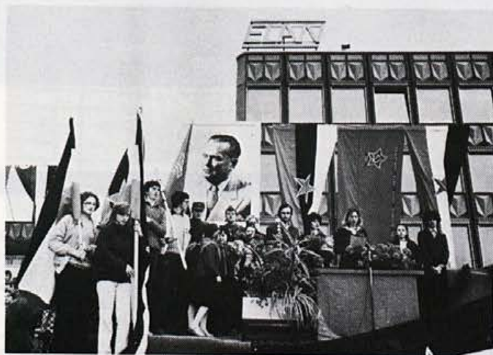
Elanov pozdrav Zvezni štafeti