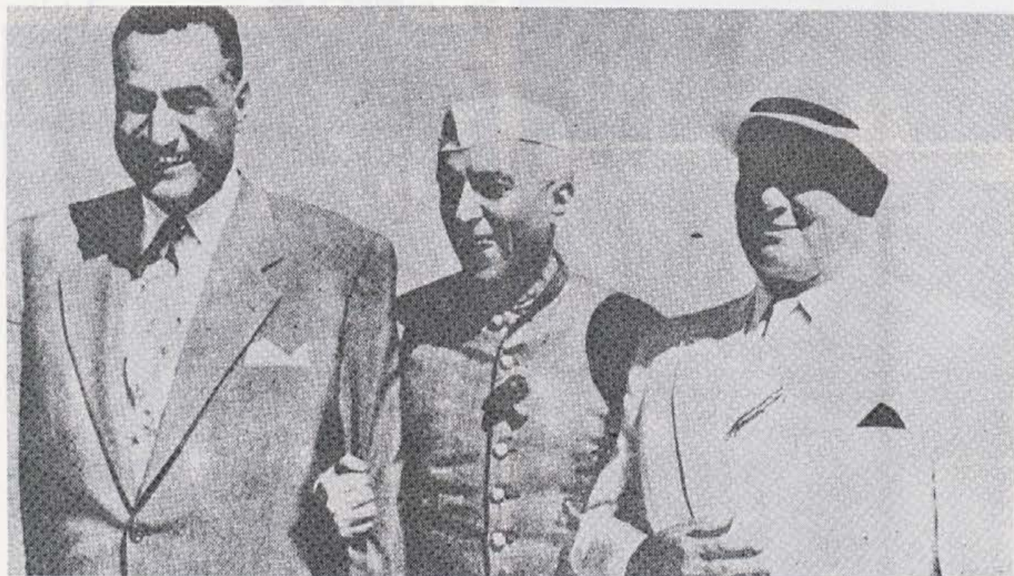
Soustanovitelj gibanja neuvrščenih