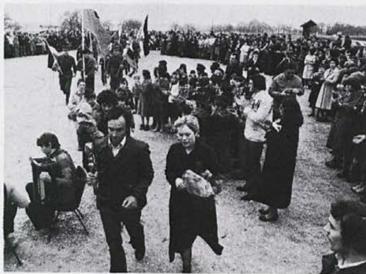
Prihod Zvezne štafete

V petek, 25. aprila 1980, sta se na poti s Primorske proti Ljubljani Zvezni štafeti mladosti pred Elanom priključili tudi Planinska in Jeloviška štafeta.