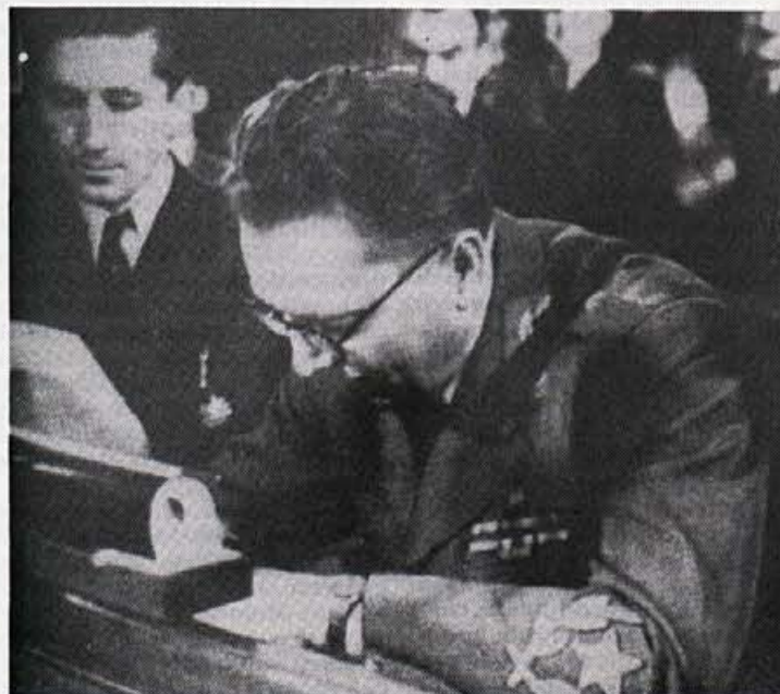
Tito podpisuje deklaracijo o razglasitvi FLRJ – 1945