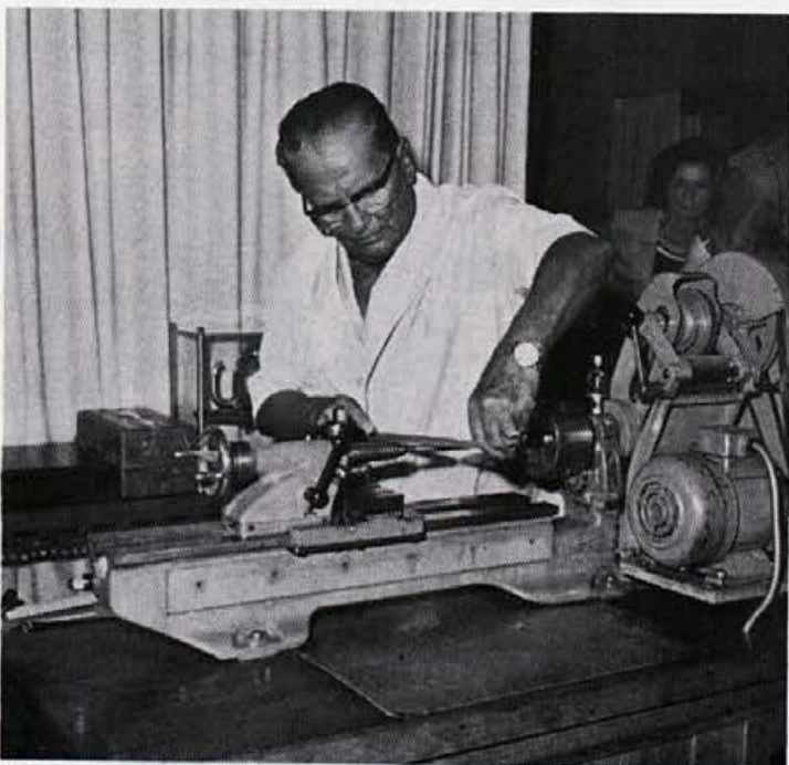
V prostem času