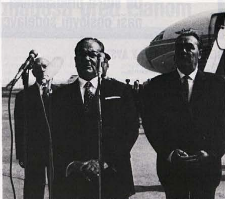
V Sovjetski zvezi