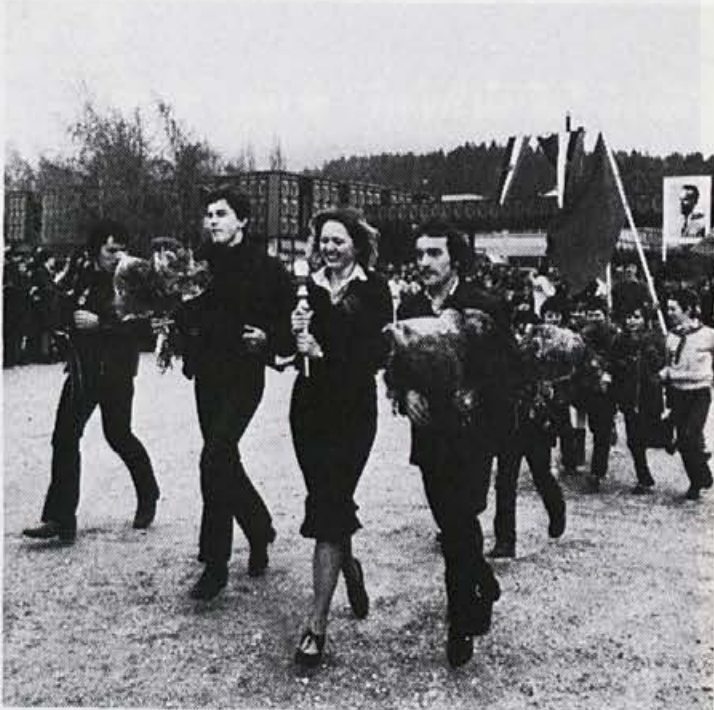
Odhod Zvezne štafete

Dragi TITO! Čaka nas še veliko dela, kajti še vedno so žive besede, ki si jih izrekel na