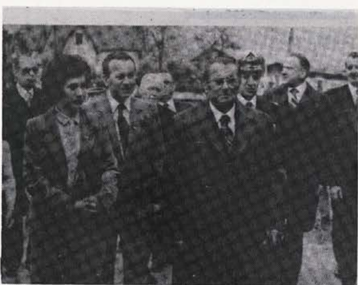
Tito v Bohinju