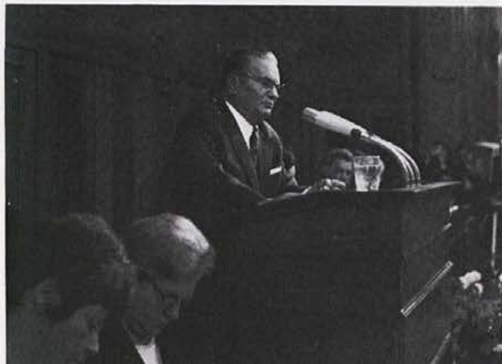
Tito govori v Zvezni ljudski skupščini