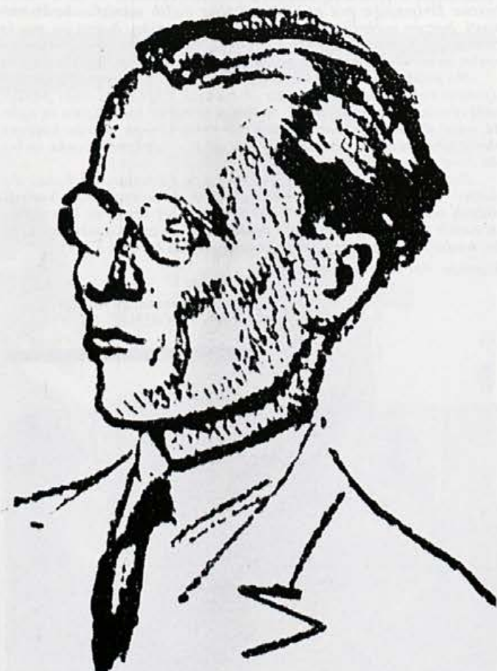
PORTRET JOSIPA BROZA, OBJAVLJEN V »NOVOSTIH« 8. NOVEMBRA 1928 V CASU BOMBARKEGA PROCESA (DELO MIHOVILA KARA).