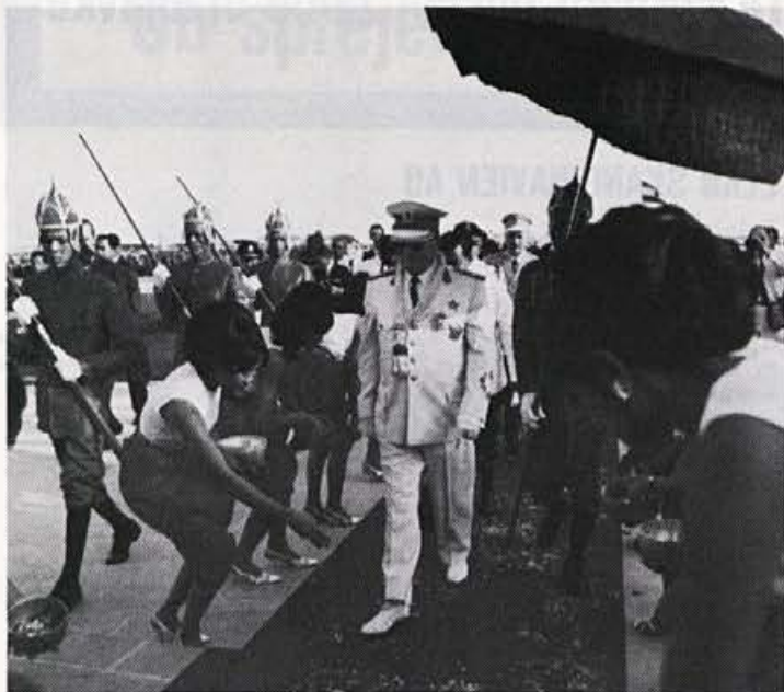
Na obisku v Aziji