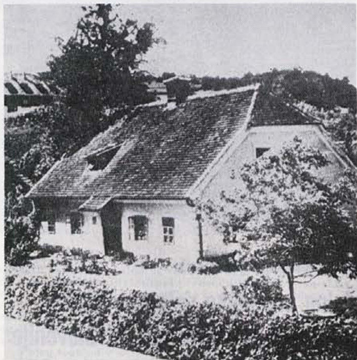
Rojstna hiša maršala Tita v Kumrovcu