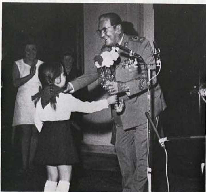
In med pionirji