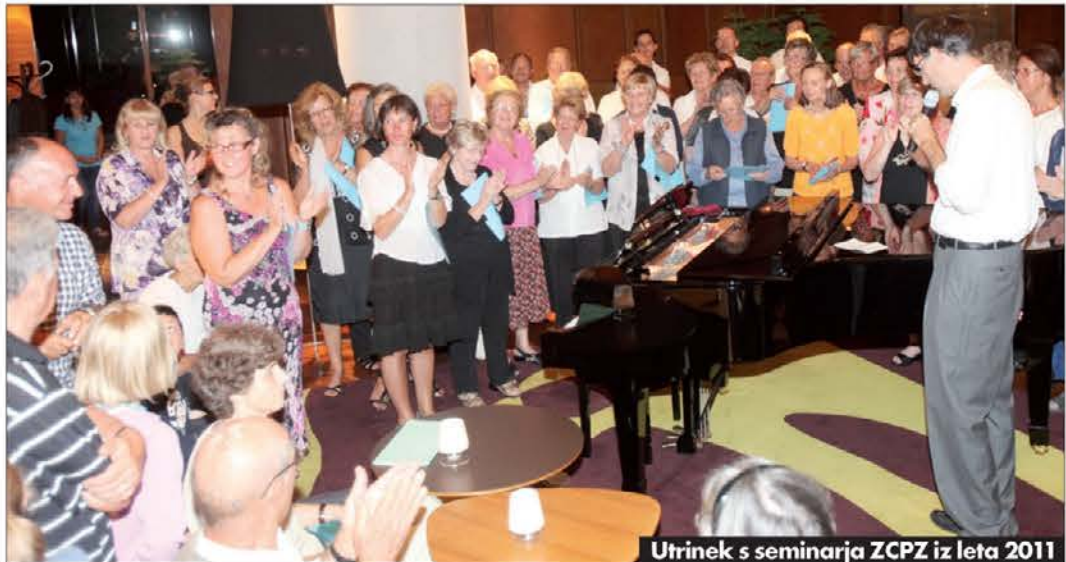
Utrinek s seminarja ZCPZ iz leta 2011