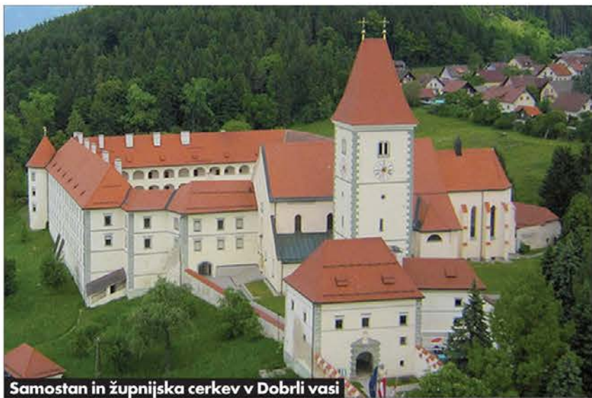
Samostan in župnijska cerkev v Dobrli vasi

stoletja, ko so bili tu jezuiti, je iz srednjeveškega kompleksa nastalo ogromno trinadstropno skoraj kvadratno dvorišče; tu se v poletnem času vrstijo gledališke predstave, koncerti ... L. 1773 je opatija prišla pod državno upravo, nato pod benediktinski samostan v Št. Pavlu v Labotski dolini.