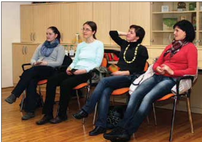
Na prvi delavnici so udeleženci razmišljali o ustvarjalnosti in inovativnosti posameznika ter skupnosti.