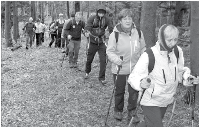
Slaba vremenska napoved ni zadržala doma preko trideset planincev.