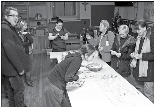
Udeleženci so pokazali veliko zanimanje za semena, setev in vzgojo novih kultur na domačem vrtu.

V času, ki je primeren za izbiro in pripravo semen ter za prve setve v posode in vsaj malo ogrevane rastlinjake, je bila tematika več kot primerna za obiskovalce, ki so lahko v brezplačni izobraževalni obliki izmenjali mnenja, izkušnje in si izmenjali semena. Par mladih navdušencev se je na srečanje pri-