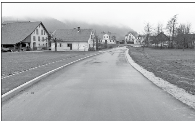
Prenovljena cesta v Varpoljah