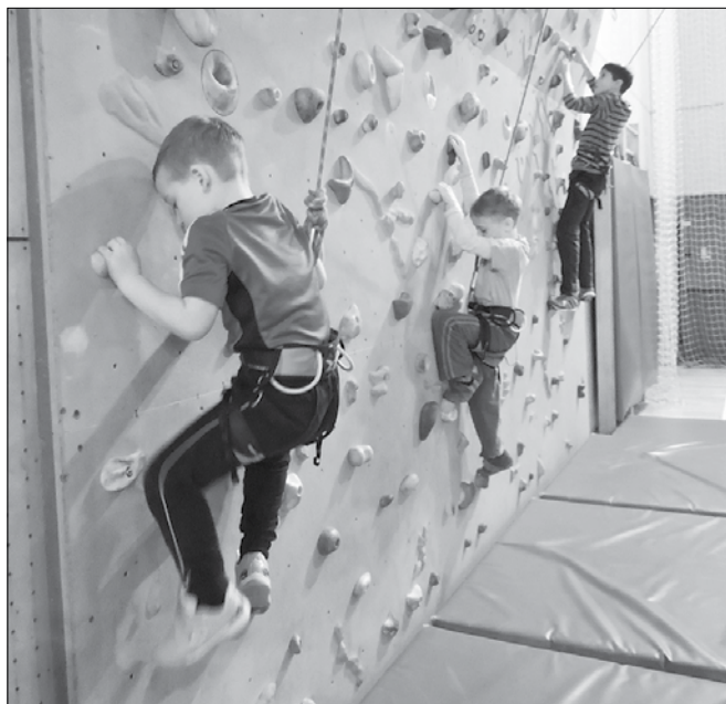
Otroci so se trudili povzpeti čim višje.