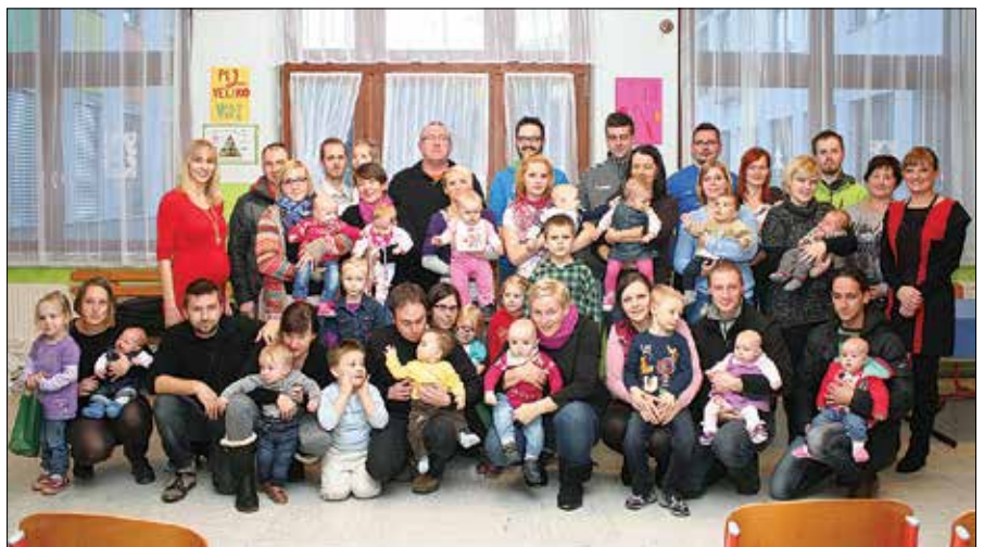
Novorojenčki letnika 2014 s svojimi družinami na sprejemu