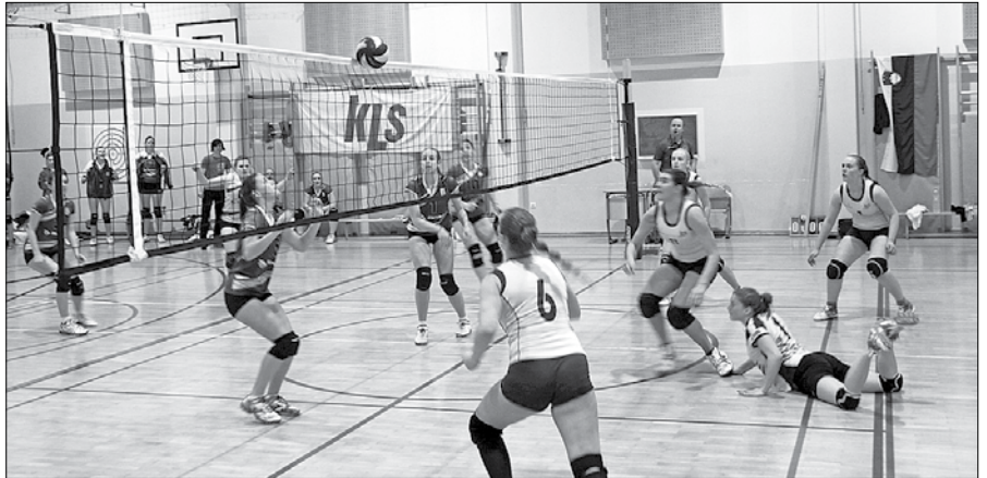
Dobra igra članic OK KLS Ljubno se je obrestovala z zmago.