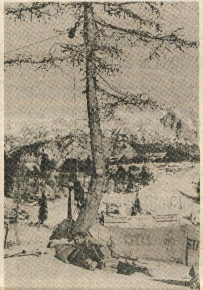
Prava zima le na Voglu - Zaradi tretje zime brez snega so žičničarji v Sloveniji na kolenih, prenekateri ljubitelji smučanja pa je bil recimo med šolskimi počitnicami prikrajšan za načrtovani oddih oziroma dopust. Za Vogel je včasih veljalo, da mora imeti za smuko vsaj meter in več snega. Letos pa je kljub nekaj deset centimetrom najbolj oblegano smučišče.