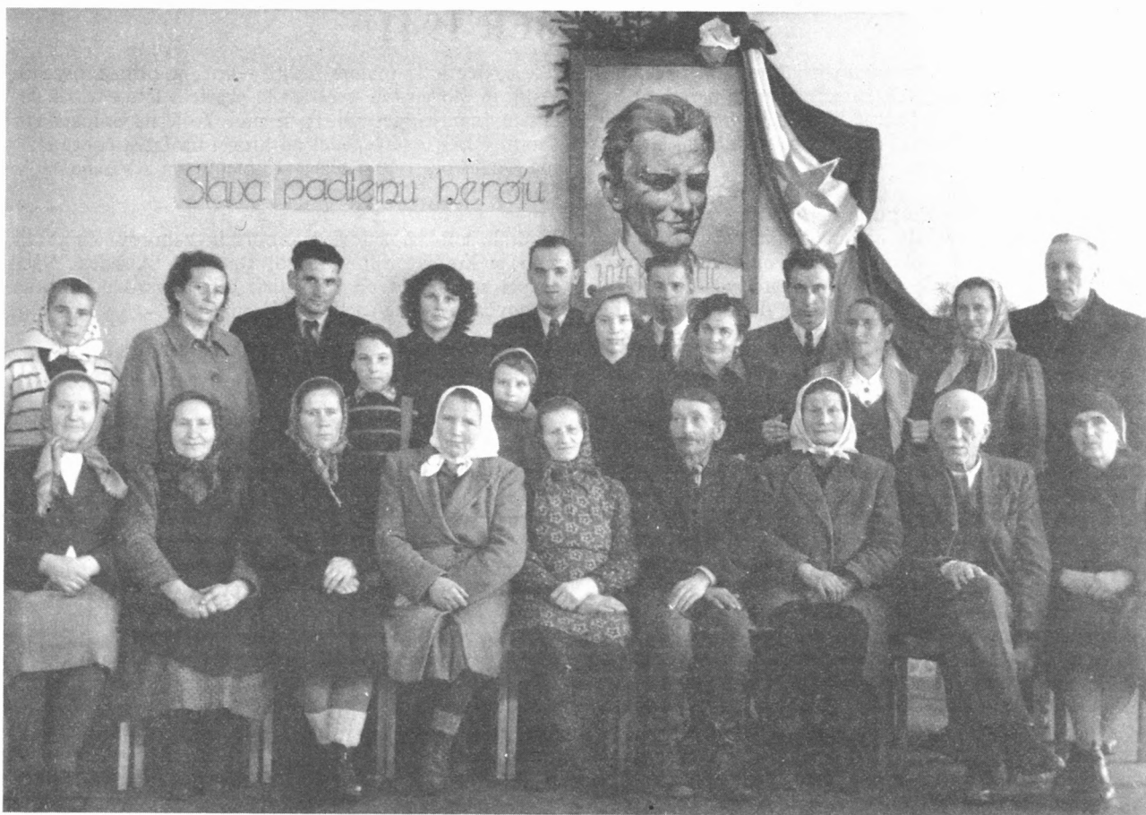
Prvi krajevni praznik na Kogu 27.12.1953.