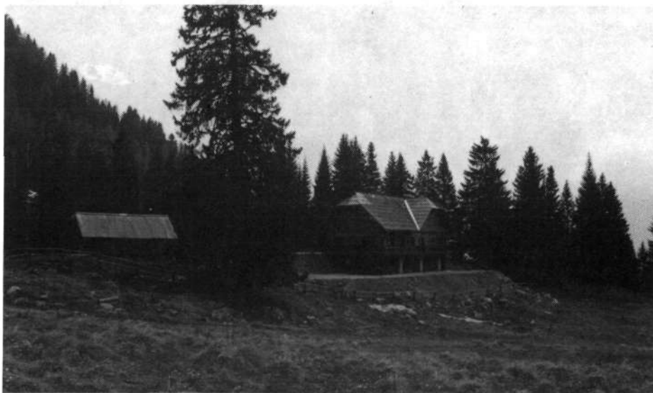
Koča v Grohotu pod Raduho

V poglavju Planinski vrhovi, postojanke in poti so na šestih straneh opisane naslednje gore: Uršlja gora, Smrekovec, Raduha in Peca. Avtor je zbral tudi vse osnovne podatke za Poštarski dom pod Uršljo goro, Kočo na Naravskih ledinah, Dom na Uršlji gori, Dom na Smrekovcu, Kočo v Grohotu pod Raduho, Dom na Peci, Kočo na Pikovem v Podpeci in za planinsko zavetišče pri Pucu v Koprivni. Fotograf je prispeval fotografije koče na Naravskih ledinah, domov na Uršlji gori in Smrekovcu in postojanke v Grohotu. Tudi tisti pohodnik, ki bo po koroških gorah hodil le s pomočjo omenjenega vodnika, se zagotovo ne bo izgubil, saj so izhodišča in dostopi jasno razloženi, knjižica pa vsebuje tudi namige za izlete. »Na pot torej!« velja prislunhiti vabilu iz novega vodnika.