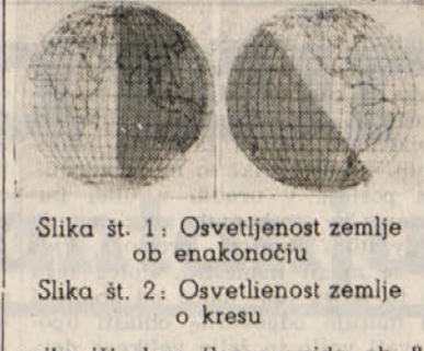
Slika št. 1: Osvetljenost zemlje ob enakočuju Slika št. 2: Osvetljenost zemlje o kresu

V jeseni se severni konec zemeljske ose odklanja od Sonca, zato se okolica severnega tečaja postopoma temni in začne previjati svojo dolgačasno šestmesečno noč. Po vsej severni poluti se dan krajša, noč pa daljša. Višek doseže ta pojav prvoga dne zime, t. j. 21. decembra, ko imamo najdaljšo noč in Tudi pot Lune okoli Zemlje kaže obliko elipse: razdalja Lune od Zemlje znaša: ko ji je najbližja 357.000 km, ko ji je najdlje pa 407.000 km. Premer Lune meri 3470 km, torej komaj 2,7 Zemljinega premera. Površina ima Luna vsega 38 mil. kvadratnih km, torej 13,2 krat manj od Zemlje. Ze s prostim očesom opazimo na Luni svetlejšje in temnejše paze, kar nam dokazuje, da je njeno površje nočno nagubano; res so ugotovili na Luni hribe z do 8000 m višine. Opazimo pa tudi, da nam Luna pokaže stalno eno in isto polovico; to zaradi tega, ker se vrtilni osi svoje ose. Ker pa potrebuje za enkratni obrat okoli osi ravno toliko časa kakor za enkratno pot okoli Zemlje (točno 27 dni 7 ur 43 minut in 11 sekund), je jasno, da vidimo vedno le eno Lunino polovico. Iz tega pa sledi, da traja Lunin dan skoro 15 naših dni, noč pa tudi toliko. Nadalje je znano, da se nam Luna ne kaže vedno v isti obliki, kar je posledica njegega kroženja okoli Zemlje. Slika 3 nam pojasni ta pojav. Okoli Zemlje Z, se vrtilna os Zemlje (Z) in zaustavljena sončna žarka, da je Luna ostala v Zemljinji senci; ker pa Luna nima svoje