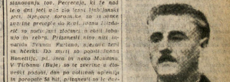
tov. ANDRIJA HEBRANG

Ta dni sta polegli dve leti, od kar sta bila na Titov ukaz aretirana na zasedanju CK bivše KPJ ob diskusiji prvega bratskega pisma VKP (b) znana jugoslovanska komunistična in vodilja, Sreten Žujčič in Andrija Hebrang.