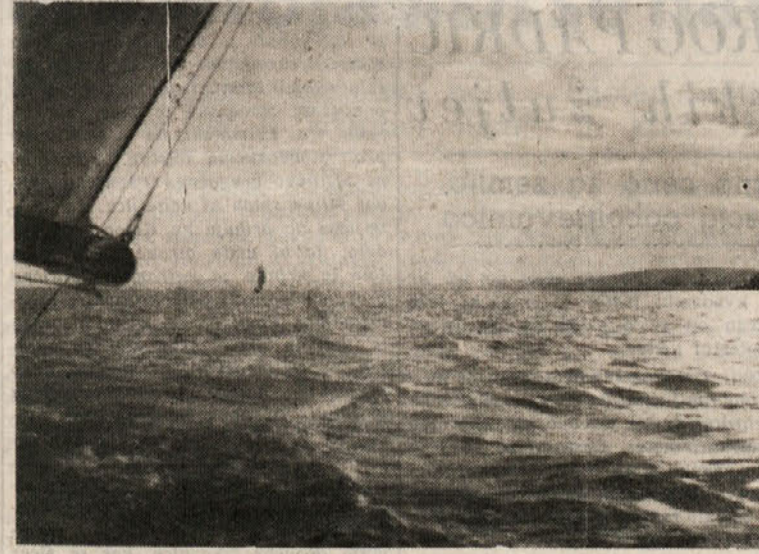
Blatno jezero na Madžarskem vabi marljivo raznašalce našega lista na 15 - dnevno letovanje