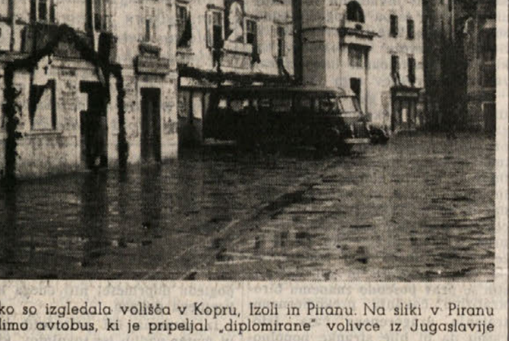
Toko so izgledala volišča v Kopru, Izoli in Piranu. Na sliki v Piranu vidimo avtobus, ki je pripeljal „diplomirane“ volivce iz Jugoslavije